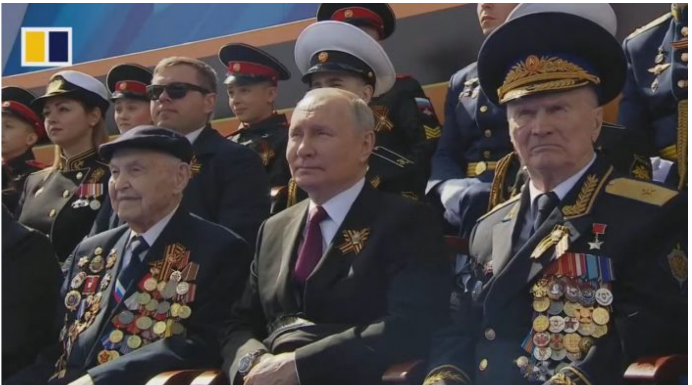
Vladimir Putin pozoruje raketové komplexy Jars

Takže proto tady máme na přehlídce jen jeden historický tank. Ale pozor... podívejte se... máme tady na přehlídce zbraně, které jsme "ještě" na Ukrajinu neposlali! A to bylo pouze de facto 6 typů zbraní: Expediční obrněné kolové transportéry Tigr v expediční verzi, nové bojové vozy na platformě Ural, raketové komplexy Iskander M, PVO systémy S-400 a strategické raketové mobilní komplexy Jars. Na závěr jely moderní transportéry APC Bumerang s protiradiační ochranou. Tím bylo řečeno vše.