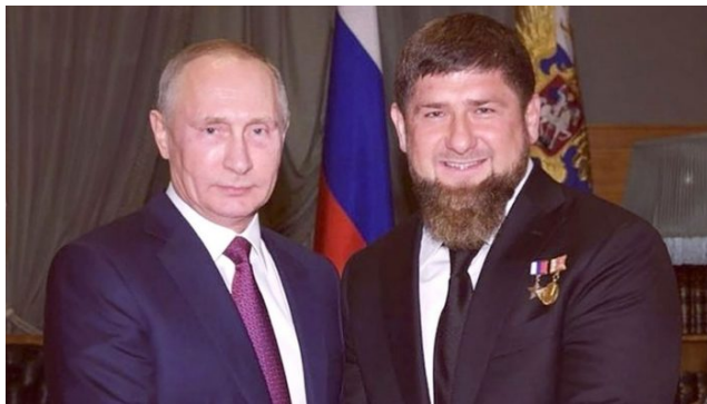
Vladimir Putin a Ramzan Kadyrov

Ta suma byla skutečně podle všeho odvozena od tabulkových cen uvedených českými médii a je naprosto neuvěřitelné, že by profesionální zloději z oboru nevěděli, co kradou, co je to za koně, kterého kradou, že je to plemenný kůň. Kadyrov přitom cenu koně netajil [3] a v březnu veřejně prohlásil, že cena koně je 10 milionů dolarů, což je pro špičkového koně odpovídající cena. Pokud by tedy šlo o krádež koně kriminálními živly, určitě by ho Kadyrovovi anebo prostředníkům, kteří pro něho pracují, neprodávali za 18 000 dolarů, tedy zhruba 400 000 Kč. Takže si sami domyslete, kdo asi tak toho koně kradl a potom prodával do podsvětí.