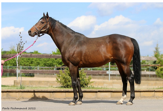
Hřebec Zazou.

Jak tedy sami vidíte, ve Fialově zemi (pozn. ČR) už jede proces ukrajinizace v takových obrátkách, že nejenom, že česká média nabízí svůj obsah v ukrajinštině, nejenom, že české banky nabízejí služby na svých pobočkách a webech v ukrajinštině, nejenom, že čeští mobilní operátoři totéž nabízí Ukrajincům na svých webech, nejenom, že do ČR přichází ukrajinská pošta s plánem nabízení poštovních služeb, nejenom, že na většině budov českých orgánů státu visí ukrajinské vlajky, dokonce i na českém Národním muzeu, ale nově se ukazuje, že do ČR konečně a po dlouhých spekulacích dorazila i ta nejvyhlášenější deviza Ukrajiny, a to poctivá, nefalšovaná a neomezená korupce!