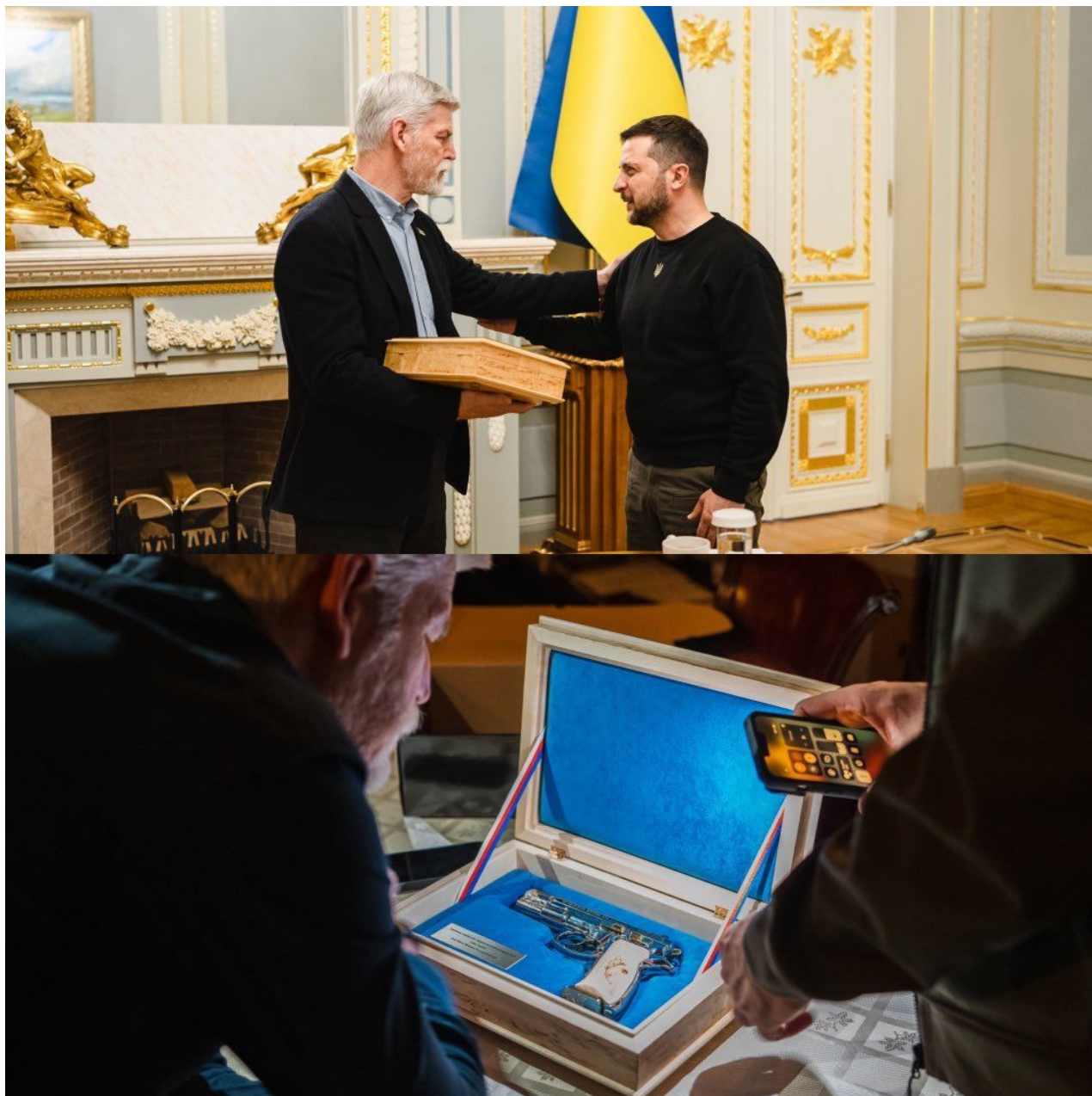
Petr Pavel předal Zelenskému při návštěvě Kyjeva gravírovanou pistoli ČZ-75 s věnováním

Rusové mají na čele fronty 300 000 mužů a zhruba 20 km vzadu je týlová fronta s dalšími 200 000 ruskými vojáky. Tato čísla vyplývají z těch uniklých tajných dokumentů Pentagonu. Jedinou možností Ukrajinců je nalezení nějakého slabého místa v ruské frontě a do toho místa Ukrajina vrhne všechny své vojáky, které chystá na ofenzívu, tedy zhruba 60 000 mužů.