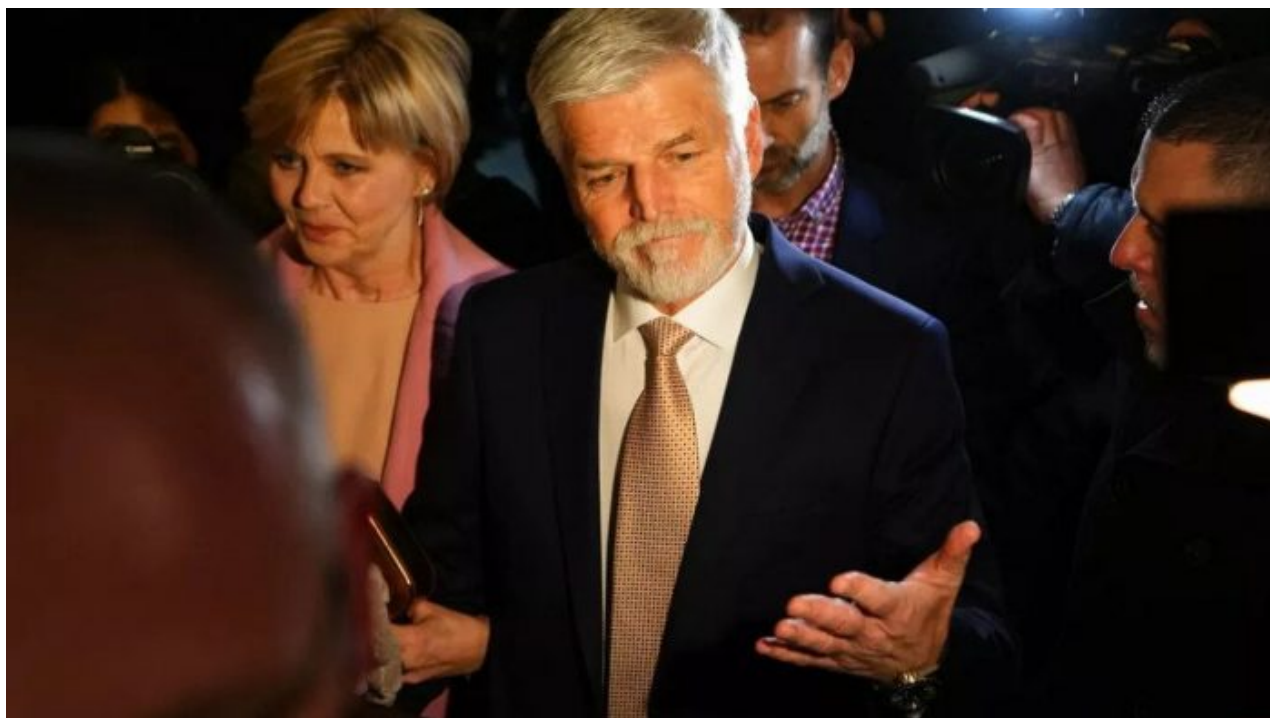
Prezident Petr Pavel

A právě proto Kissinger hovoří o prognóze vyjednávání o ukončení bojů již ke konci tohoto roku. Tomu se prostě nedá vyhnout. Bez munice, dělostřelectva a masivní armády, kterou 60 000 mužů rozhodně není, jsou šance na úspěch ofenzívy tak mizivé, že prakticky nic jiného než jednání o příměří nepřipadá ke konci roku v úvahu.