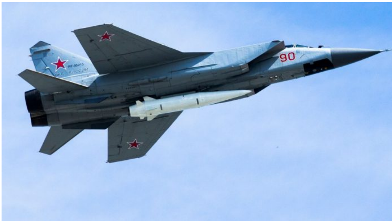
Raketa Kinžál (KH-47M2) na záchytné stíhačce MiG-35

Kyjev tak znovu vypustil neuvěřitelnou kachnu, kterou dokáže vyvrátit i malé dítě, které umí číst a vyhledávat informace na internetu. Dva a půlkrát pomalejší raketou opravdu Kinžál neseštelíte, a to ani omylem. Jedinou možností, jak by mohla raketa Kinžál spadnout, je technická závada, selhání náporového motoru rakety, který spaluje atmosférický kyslík namísto paliva, trefení ptáka během letu apod.