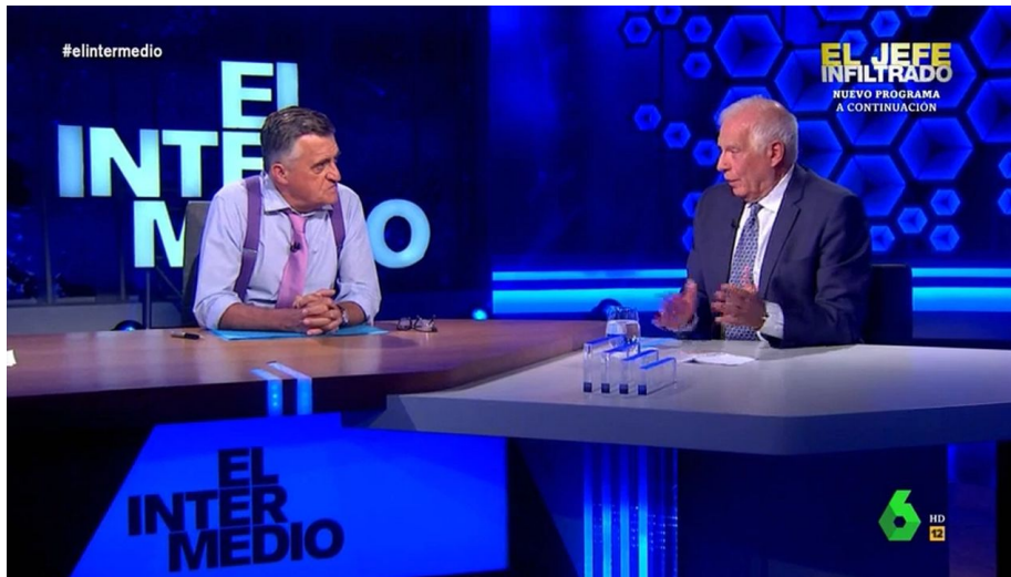
Josep Borrell v pořadu španělské televize

to zopakovalo, ale ve větším formátu. Ukrajinci by s sebou přitáhli tolik západních zbraní, které dostali ze západu, že by se z nich rázem stala nejsilnější armáda v EU a byli by si své síly vědomi. A měli by požadavky na EU.