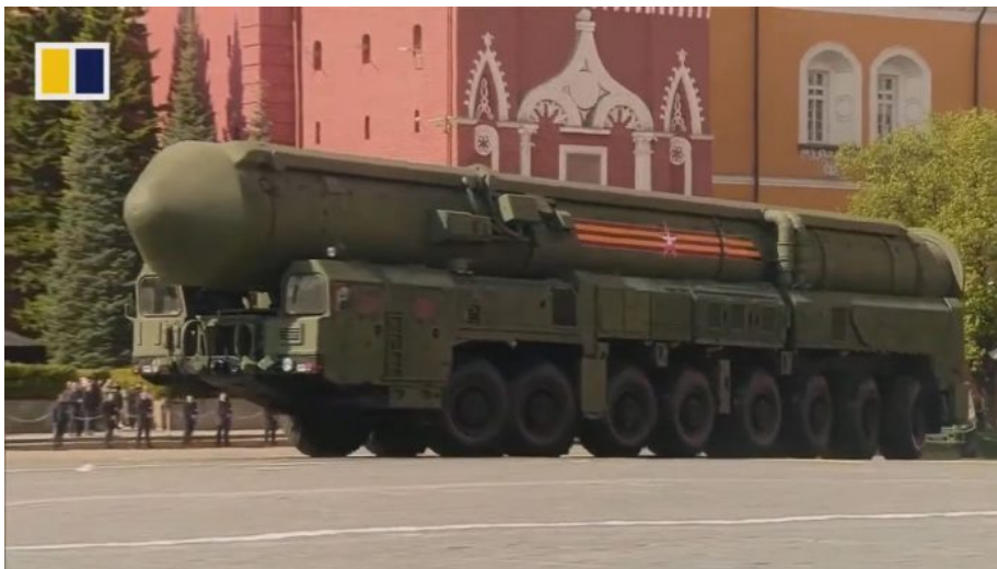
ICBM komplex Jars

Tažené kanóny nebyly na přehlídce. Jsou na frontě! A stíhačky, helikoptéry a bombardéry neletěly nad Rudým náměstím. Jsou totiž nad frontou! Takže... co ještě není na frontě? No přece těch pár typů zbraní, co jste viděli na přehlídce! Naprosto dokonalý symbol a vzkaz vyslaný na západ. Klasický Putinův vtípek, který vyděsí a na západě ho někteří i pochopí. Někteří. Ten vtípek je ale myšlen vážně. Pouze tyto typy zbraní, expediční mašiny, Iskandery, S-400 a Jars balistické ICBM rakety spolu protiradiačními APC Bumerang dosud a zatím Kreml nepoužil... na frontě.