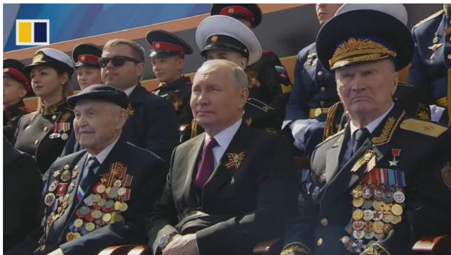
Vladimir Putin pozoruje raketové komplexy Jars

Takže proto tady máme na přehlídce jen jeden historický tank. Ale pozor... podívejte se... máme tady na přehlídce zbraně, které jsme “ještě” na Ukrajinu neposlali! A to bylo pouze de facto 6 typů zbraní: Expediční obrněné kolové transportéry Tigr v expediční verzi, nové bojové vozy na platformě Ural, raketové komplexy Iskander M, PVO systémy S-400 a strategické raketové mobilní komplexy Jars. Na závěr jely moderní transportéry APC Bumerang s protiradiační ochranou. Tím bylo řečeno vše.