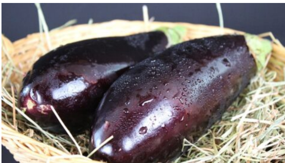
Úžasné účinky lilku na lidské zdraví – od superpotravy k medicínskému využití