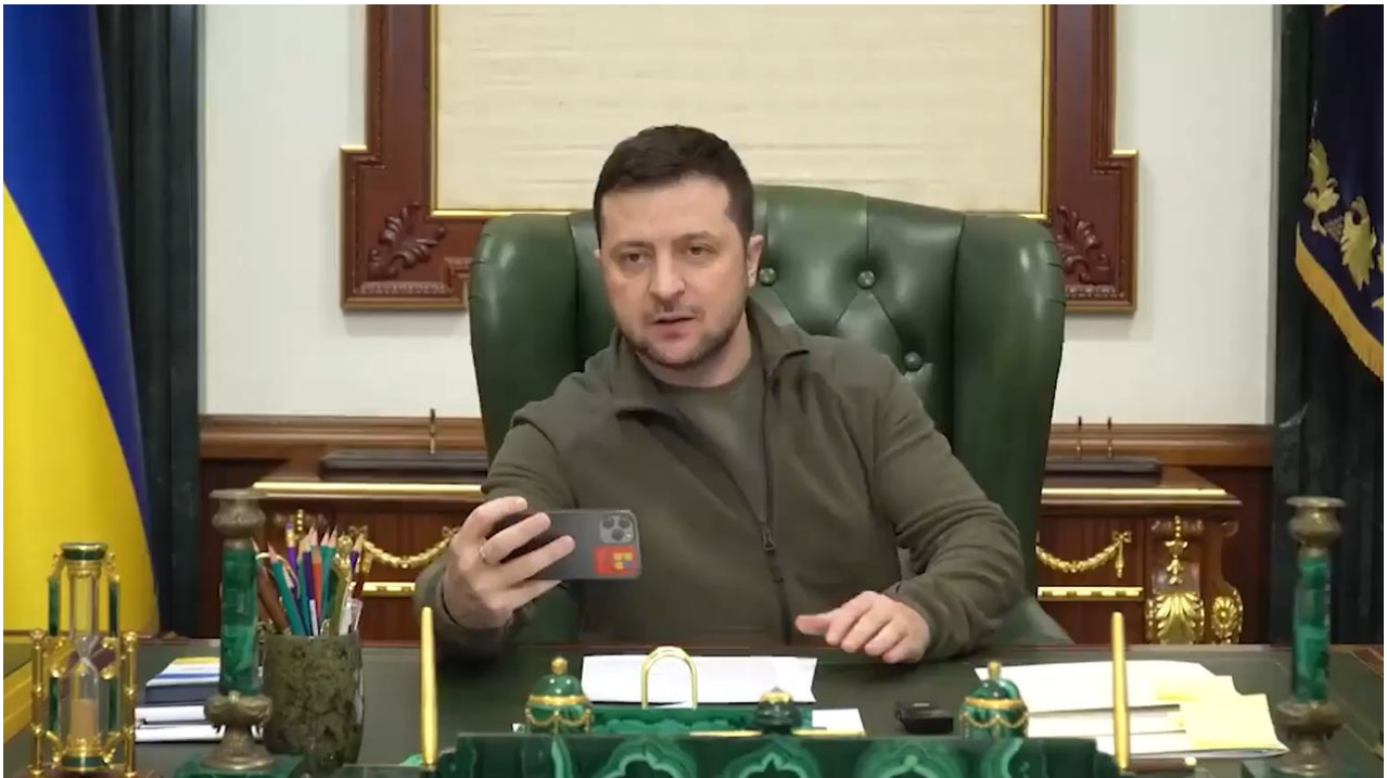
Zelenský ve své kanceláři při natáčení selfie videa na telefon

Zelenský potom nelenil a o 2 hodiny později vylezl z bunkru a natočil to slavné video na mobilu, kde prohlásil, že se nebojí, a že zůstane na Ukrajině a nikam nebude utíkat! A je to venku! Žádné hrdinství židovského prezidenta Zelenského, ale obyčejná židovská dohoda mezi židovským a ortodoxním premiérem Izraele Naftali Bennettem a ruským chasidským prezidentem Vladimírem Putinem. Teprve po potvrzení z Moskvy, že Zelenský není na ruském “hit listu“ , se Zelenský odvážil vylézt z bunkru a začal rozhazovat odvážně rukama, podobně jako Fiala, a prohlašovat, že zůstane na Ukrajině. Chucpe č. 2!