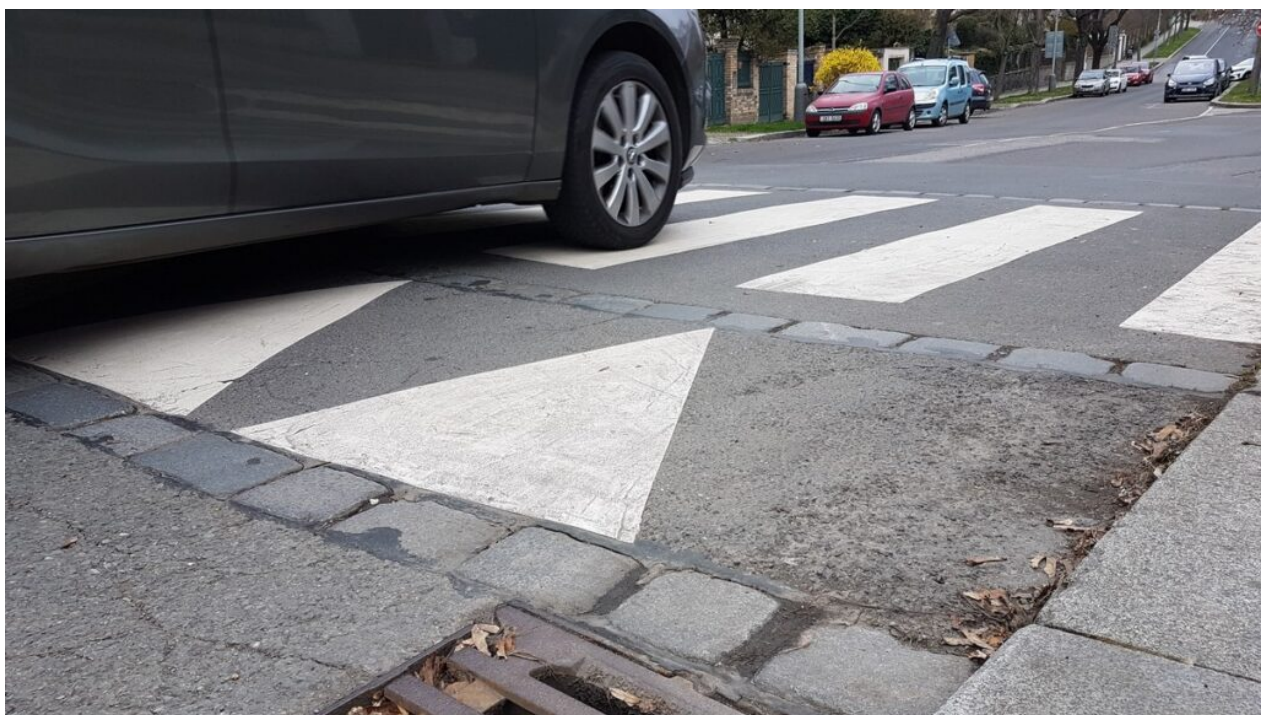
Ulice Na Hřebenkách | Praha 5 | 23. března 2023 | foto Kverulant.org

Česko má jednu z nejpodivnějších ulic. Řidiči na pár metrech musí přejet sedm zpomalovacích prahů. V Praze 5, v ulici Na Hřebenkách, bylo za 24,5 milionu korun z kapes daňových poplatníků v roce 2010 vybudováno v úseku 431 metrů sedm velkých retardérů. Nestalo se tak ve veřejném zájmu, ale pro klid miliardáře Marka Dospivy, který si tam koupil vilu. Od té doby Kverulant usiluje o redukci těchto retardérů, ale teprve na jaře 2022 se mu dostalo slibu, že se tak stane v létě roku 2022. Ale stavební povolení bylo vydáno teprve na konci roku 2022 a stavební práce ještě ani nezačaly. Dokud nebude redukce retardérů hotová bude Kverulant obtěžovat všechny odpovědné politiky a úředníky. Podpořte Kverulantův vytrvalý boj proti mocným papalášům alespoň malým finančním darem.