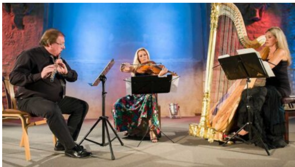
Koncertní trio zahájí festival Procházky uměním v Trojském zámku na začátku května