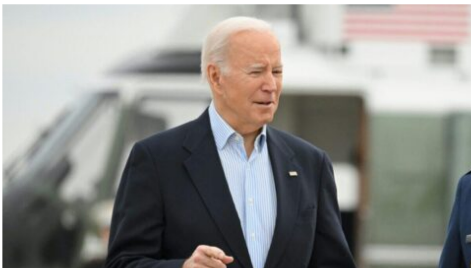
Joe Biden oficiálně oznámil kandidaturu do voleb 2024. V průzkumech však jeho popularita klesá