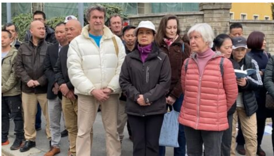
Protest před čínským velvyslanectvím v Praze. Falun Gong a výročí shromáždění v Pekingu 25. dubna 1999