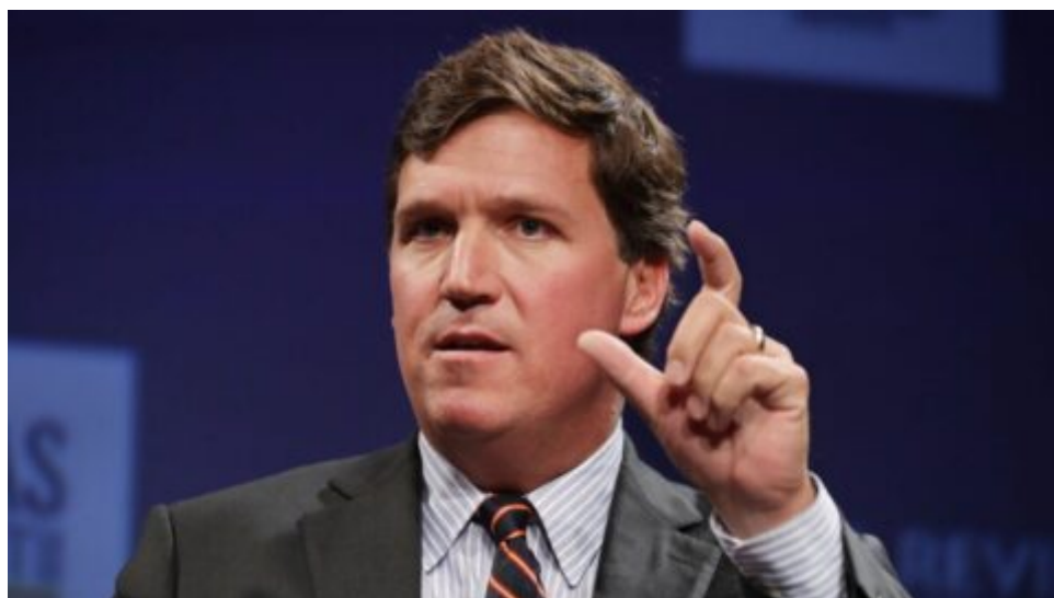
První video zpráva Tuckera Carlsons po odchodu z Fox News a důsledky kroku pro stanici