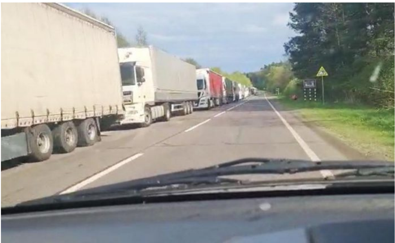
Ukrajinské kamiony s obilím na polské hranici v květnu 2022 [1]

Když už byste si mysleli, že nejhorší česká vláda od roku 1993 nemůže překvapit větší protinárodní a protilidovou operací, tak se znovu ukáže, že vynalézavost Fialovy vlády v tom, jak škodit českému lidu, nezná hranic. O víkendu totiž došlo k rozhodnutí Maďarska a poté Polska o tom, že s okamžitou platností zastavují dovoz ukrajinského obilí, protože obsahuje pesticidy a rovněž GMO modifikované enzymy. Ukrajina totiž používá k pěstování obilí americké geneticky modifikované obilí, které vlastně dnes už není americké ale německé, protože průkopníka v oblasti GMO obilí, americkou firmu Monsanto, v roce 2018 koupil německý chemický gigant Bayer.