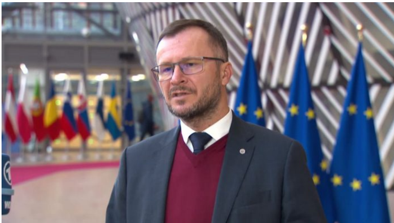
Ministr zemědělství Zdeněk Nekula

Slovensko tak zakázalo import obilí z Ukrajiny v podstatě z ekonomických důvodů, že to poškozují vnitřní trh v EU, když je zaplaven ultra levným ukrajinským obilím. Jenže, český ministr zemědělství Zdeněk Nekula (KDU-ČSL) zákaz dovozu ukrajinského obilí odmítl [3], že prý se musí počkat na to, až jaké opatření přijme Brusel a Evropská unie jako celek! Do té doby bude do ČR proudit ukrajinské obilí!