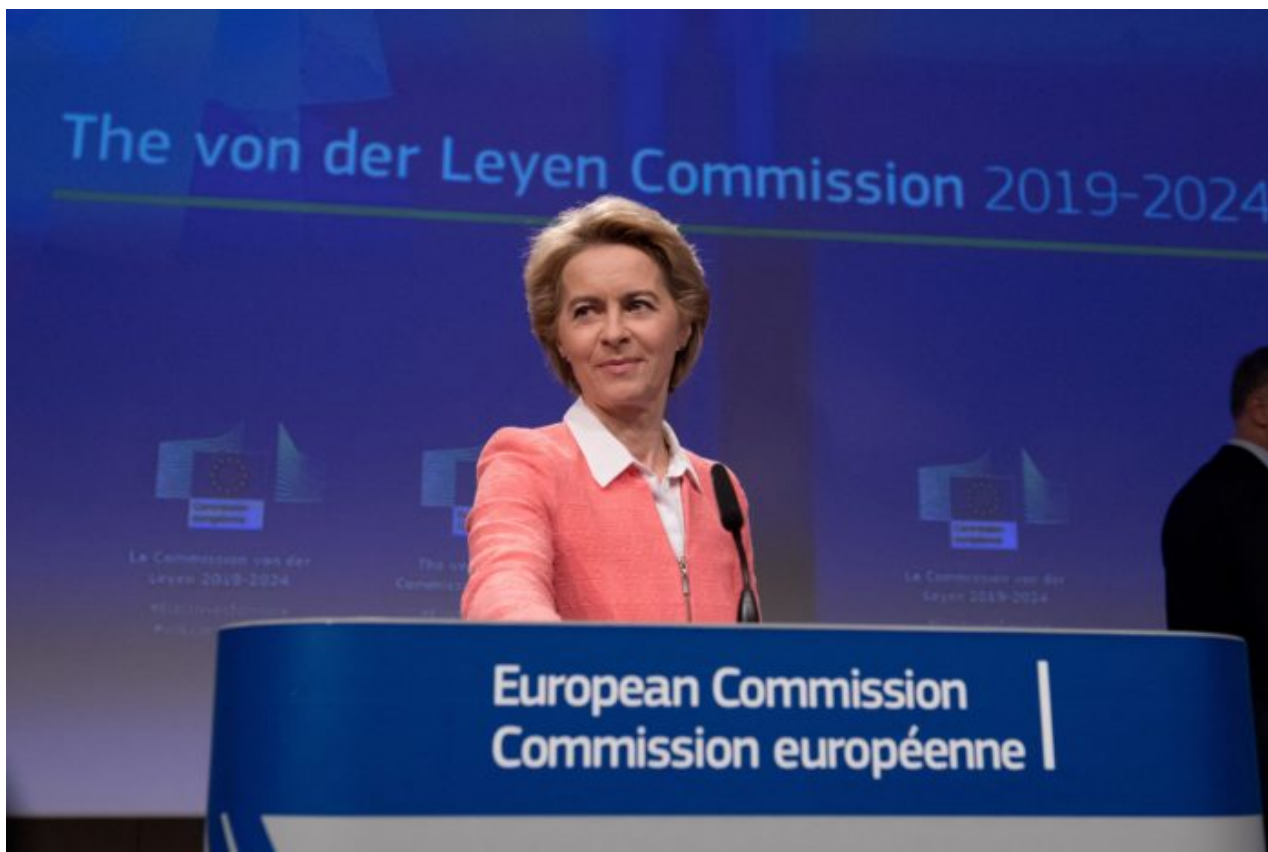
Ursula von der Leyen, šéfka Evropské komise

Brusel začne proto tvrdit, že se není čeho bát, že ukrajinské obilí je bezpečné, že tam nejsou pesticidy, že to není GMO obilí, nebojte se, nic se vám nestane! Přitom samotná Evropská unie ve své studii uvádí [6], že Ukrajina mezi lety 2015 až 2019 zvýšila používání pesticidů v zemědělství o neuvěřitelných 47% a tento trend podle studie bude pokračovat. A podle varování [7] a studie OSN používá Ukrajina každý rok v zemědělství neuvěřitelných 100 000 tun pesticidů pro ošetřování své zemědělské produkce, především obilí.