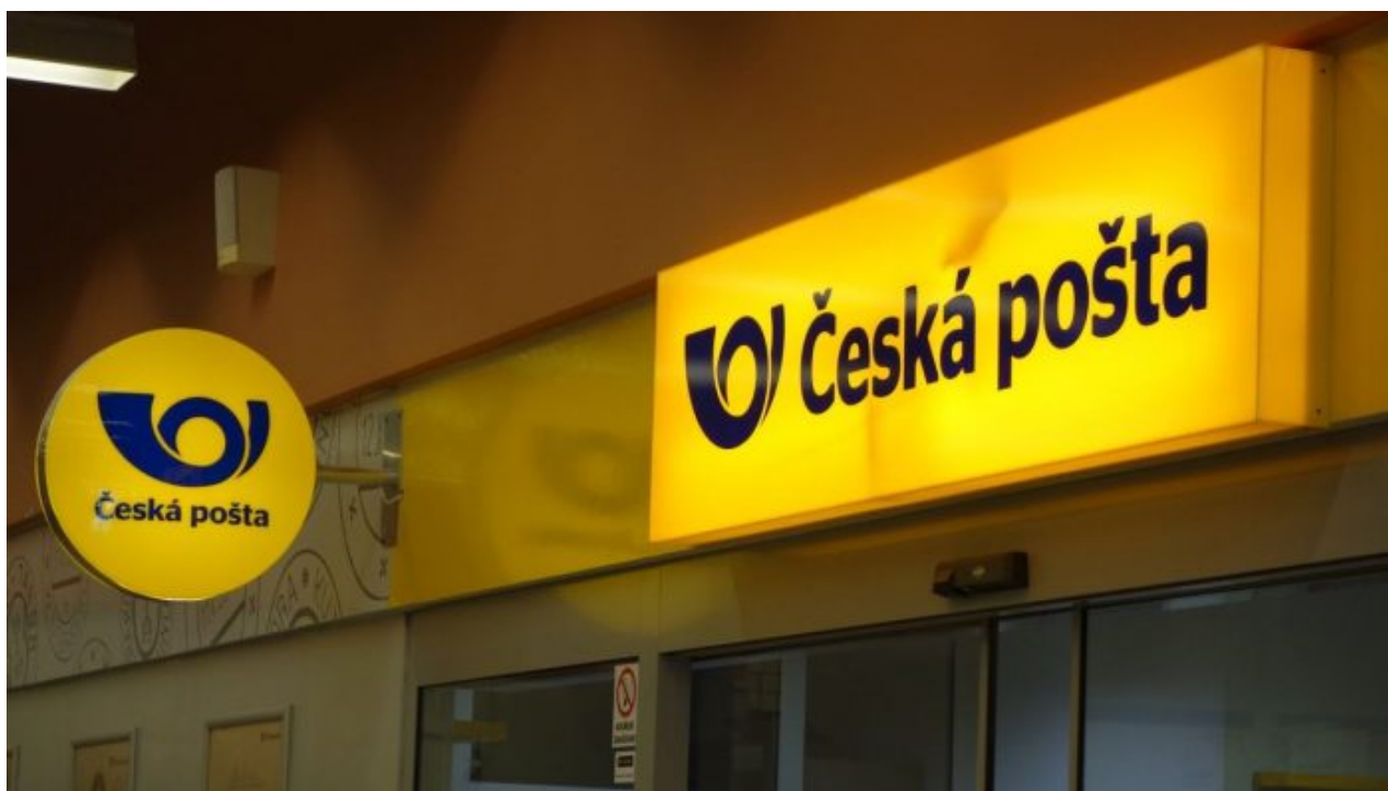
Česká pošta, s.p.

Do toho ale není ani započítán rozsáhlý vozový park, takže Česká pošta jako státní podnik je posledním obrovským kusem státního majetku, který lze pod nějakou záminkou či dokonce úmyslnou destrukcí ekonomiky České pošty neschopným vedením prostě rozprodat a tím sanovat státní rozpočet rozbouraný Fialovou vládou. Když je vláda v koncích, nemá z čeho brát, začne se rozprodávat státní majetek. Kouká se, kde co by se dalo prodat, pod nějakou záminkou nefunkčnosti, ztrátovosti atd.