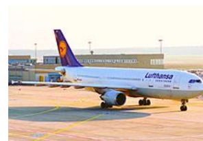
Airbus A300-603 letecké společnosti Lufthansa

V září 1967 britská, francouzská a německá vláda podepsaly Memorandum o porozumění a mohl začít vývoj 300místního Airbusu A300 . Byl to druhý velký společný letecký projekt v Evropě, po Concordu , pro který nebylo založeno žádné trvalé konsorcium. První oznámení o projektu byla učiněna v červenci 1967, ale situaci zkomplikovala společnost British Aircraft Corporation (BAC), která chtěla sama vyvinout podobný letoun ( BAC 3-11 ) založený na již existujícím BAC 1-11 . Britská vláda se ale odmítla postavit za vývoj BAC 3-11 a místo něj podpořila Airbus. V měsících, které následovaly po uzavření dohody, jak francouzská, tak britská vláda vyjadřovaly své pochybnosti o budoucnosti celého projektu. Dalším problémem byla nutnost vývoje nového motoru společností Rolls-Royce , RB207. V prosinci 1968 partnerské společnosti z Francie a Británie, Sud Aviation a Hawker Siddeley , navrhly pozměnit konfiguraci letounu na 250místný Airbus A250. Letoun, vzápětí přejmenovaný na A300B, nevyžadoval nové motory, což významně snížilo náklady na vývoj.