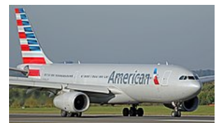
Rolující Airbus A330-300 americké letecké společnosti American Airlines