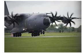
Vojenský letoun Airbus A400M

V červenci 2004 Harry Stonecipher (generální ředitel Boeingu) obvinil Airbus z porušování nezávazné dohody o vládní pomoci z roku 1992. Airbus dostává finanční půjčky od evropských vlád na vývoj nových letadel, které musí později vrátit i s jistým úrokem, ale pouze tehdy když je daný typ letadla komerčně úspěšný. [14] Airbus tvrdí, že takový systém je v souladu s dohodou z roku 1992 a pravidly Světové obchodní organizace (WTO). Dohoda dovoluje, aby až 33% nákladů na program bylo hrazeno vládními půjčkami, které musí být plně splaceny během 17 let včetně všech úroků a poplatků. Minimální úroková míra těchto půjček je rovna nákladům vlád na půjčky plus 0,25%, což je pod úrokovou mírou, kterou by Airbus musel zaplatit na volném trhu bez podpory vlád. [15] Airbus udává, že od podpisu evropsko-americké dohody v roce 1992 splatil evropským vládám více než 6,7 miliardy dolarů a že to je o 40% více než kolik dostal. [16]