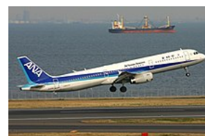
Vzlétající Airbus A321 společnosti All Nippon Airways