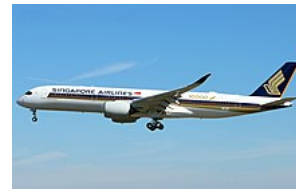
10000. vyrobený letoun společnosti Airbus ( Airbus A350-900 společnosti Singapore Airlines )

Společnost Airbus S.A.S. , známější jen jako Airbus , se sídlem v Toulouse, Francie , je jeden ze dvou největších světových výrobců civilních dopravních letadel (spolu s firmou Boeing ). Společnost byla založena v prosinci 1970 ve francouzsko-německo-britské spolupráci a je součástí holdingu Airbus . [3] Airbus v roce 2016 zaměstnával přes 72 000 lidí po celém světě, hlavně ve Francii, Německu, Velké Británii a Španělsku . Konečná montáž se provádí v Toulouse (Francie) a Hamburku (Německo). Hlavním (a v současnosti v podstatě jediným) konkurentem Airbusu je Boeing , se kterým Airbus vede intenzivní obchodní válku.