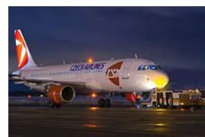
Airbus A320-214 české letecké společnosti České aerolinie

Prvním výrobkem Airbusu byl typ A300, první letoun na světě s dvěma uličkami a dvěma motory. Kratší varianta A300 je známá jako A310 . Po úspěchu svých prvních typů představil Airbus typ A320 s inovativním systémem řízení fly-by-wire (tj. z kokpitu se přenášejí pouze elektrické signály k servomotorům). A320 byl velkým komerčním úspěchem. A318 a A319 jsou kratší verze A320, přičemž A319 je dodáván také v úpravě pro podnikovou sféru jako biz-jet ( Airbus Corporate Jet ). A321 je prodloužená verze A320 a je přímým konkurentem nejnovějších modelů Boeingu 737 .