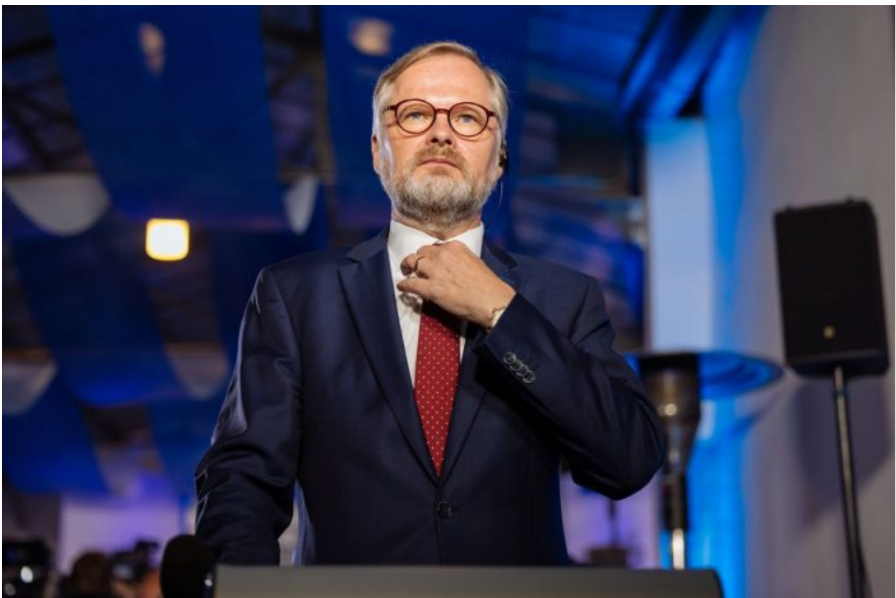
Petr Fiala se postupně vžívá kroky své vlády do role Vůdce

Nesnesitelná lehkost bytí spočívá v repetitivních úkonech. V opakování toho, co řve do ampliónu ředitel koncentráku a v držení pochodového kroku udaným směrem někam. Třeba k Ukrajině. K válce. Kdo to zvládne, bude mít lehké bytí. Bude mít práci. Bude mít bydlení. Bude mít klid. Nesnesitelnost přijde záhy poté, co si améby uvědomí, že přijatá podoba proměny má za cíl je zabít, pomalu, anebo rychle.