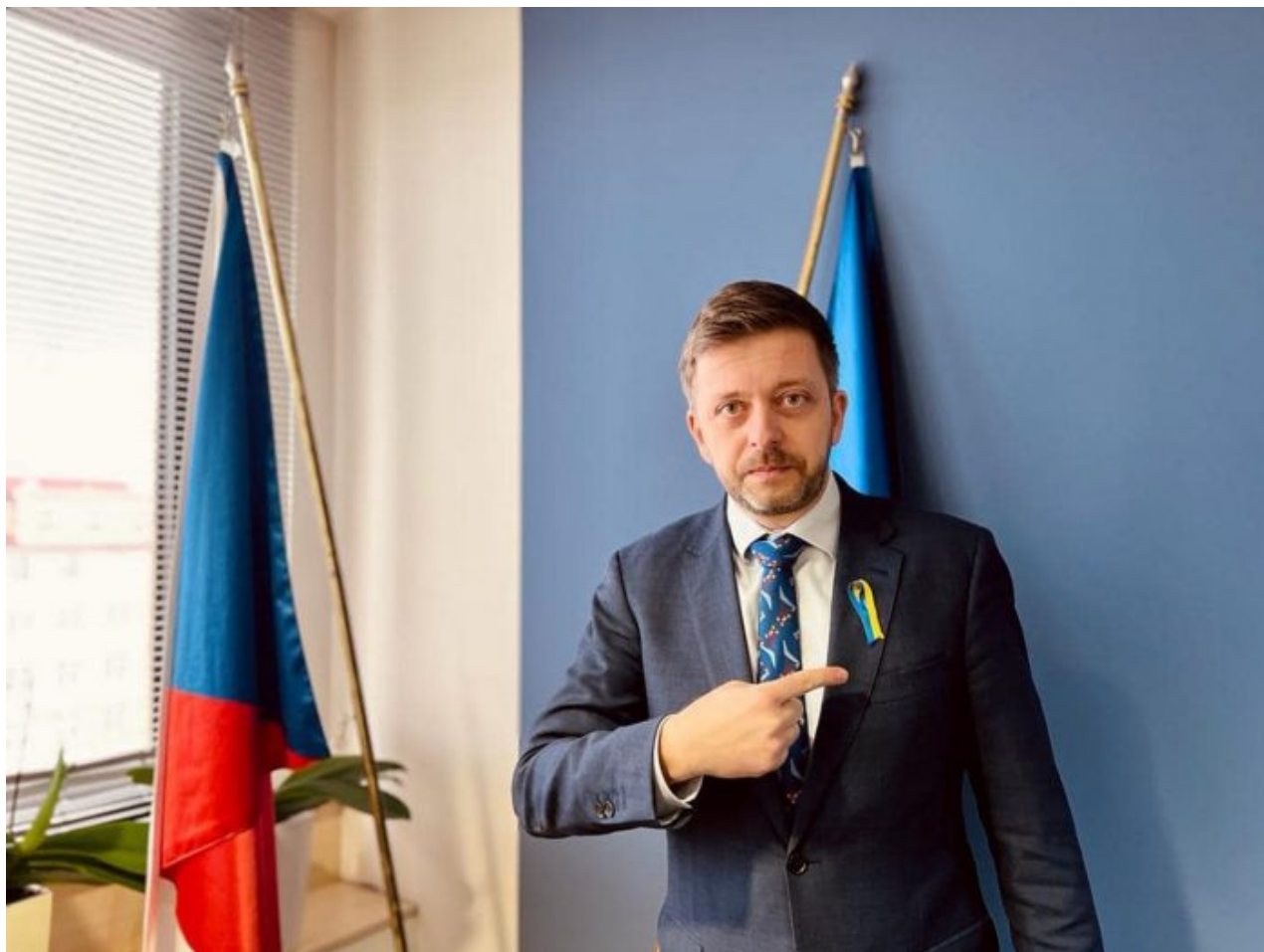
Ministr vnitra Vít Rakušan

Ten okamžik přijde jako blesk, zničehonic, jako mrazivý nůž vám zajede do srdce a odřízne něco, co vás poutalo k vlasti, protože vaše vlast už to není. Ne to, co se z ní stalo. Právě proto Milan Kundera je nadčasový spisovatel, který vystihl podstatu vlastenectví. Je to snaha vrátit z dálky a z ciziny zpět tu vlast, kterou kdysi byla, než se to v ní všechno “posralo” a zasloužili se o to “lidi“, co v té vlasti teď žijí a přeměnili se v něco, co nepoznávám. Tohle teď zažívají hlavně Němci, emigranti v Argentině a v USA, kteří nevěří vlastním očím, co se stalo s Německem. Češi v cizině nevěří, co se děje s Českem, Slováci se Slovenskem. Uvedeme si proto svědectví našeho čtenáře, který emigroval do Brazílie. Popsal nám ve výčtu všechno, co šlo. Je to drsné čtení.