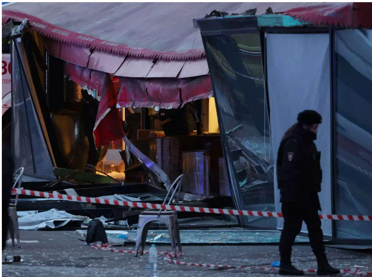
Výbuch v kavárně v Petrohradu

Po získání Krymu zboříme Kerčský most, představil své plány Kyjev