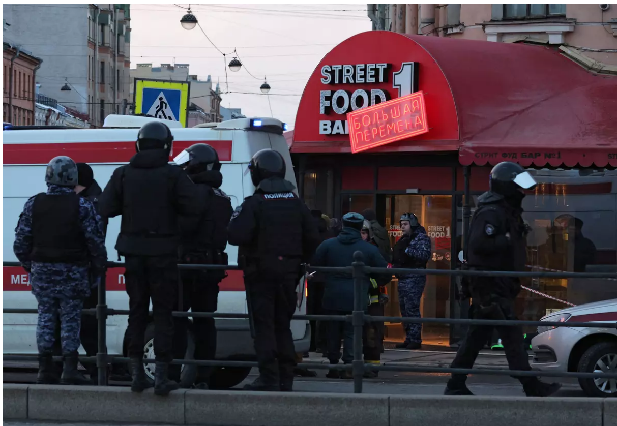
Výbuch v kavárně v Petrohradu