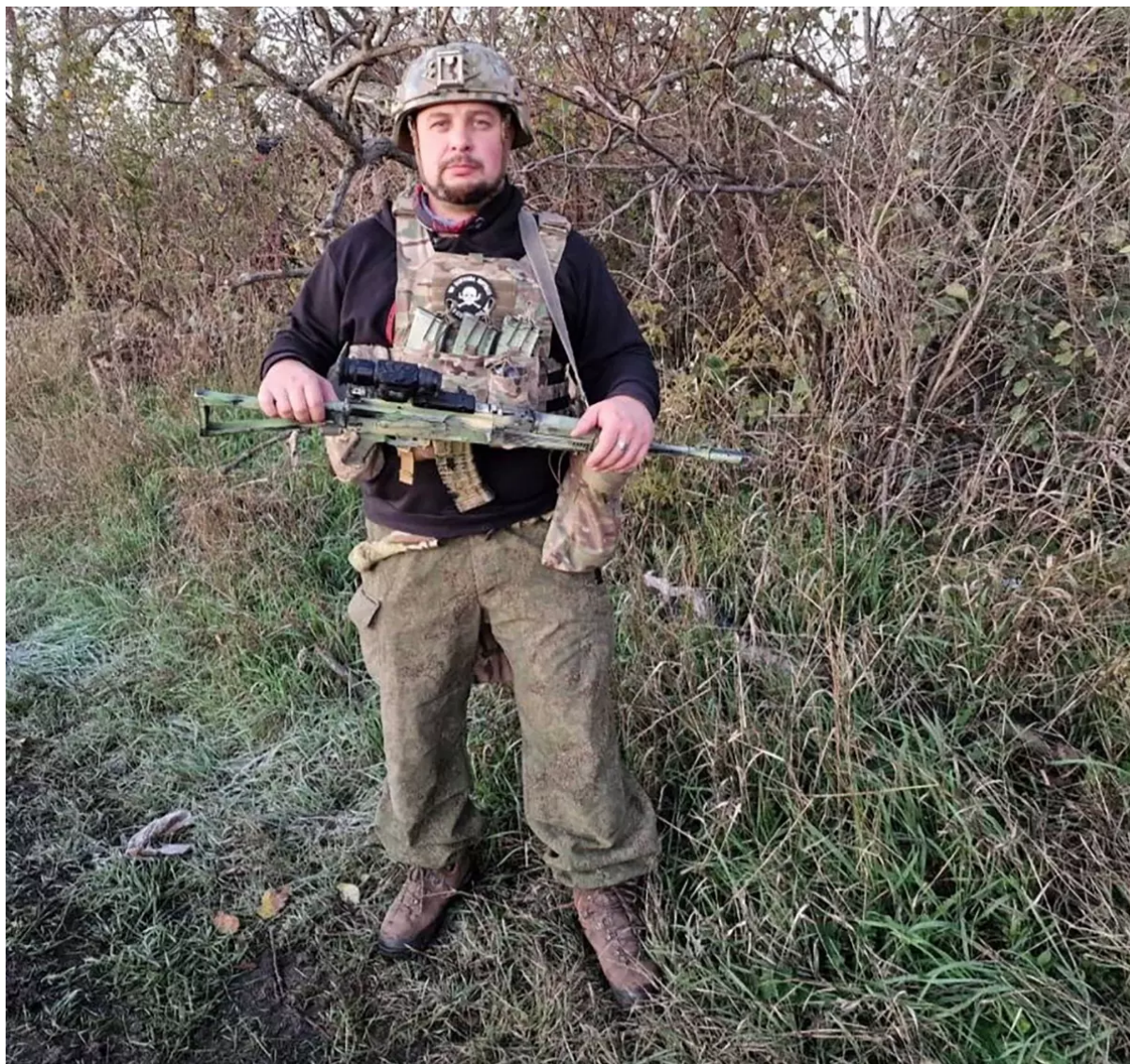
Vladlen Tatarskij

Jde už o druhý podobný útok v Rusku na významnou osobu spojenou s válkou na Ukrajině. Loni v srpnu zahynula při explozi vozu Darja Duginová, dcera ultranacionalistického ruského ideologa Alexandra Dugina, který měl být zřejmě původně terčem atentátu. Ruská tajná služba FSB útok přisoudila ukrajinským tajným službám. Kyjev to popřel.