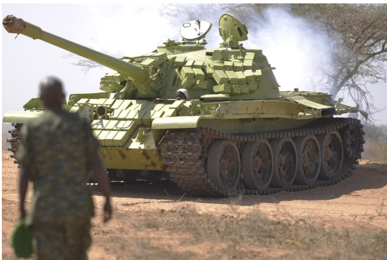
Foto: Uganda disponuje více než stovkou tanků T-54/55. Ty v posledních dnech začalo zprovozňovat i Rusko v rámci bojů na Ukrajině.

I přes výše uvedená tvrzení je zapojení ugandských jednotek do konfliktu na Ukrajině v podstatě nereálné. Jednak v zemi panuje diplomatické tření se sousední Keňou a dále by neměl případný transfer ugandských vojáků do Ruska žádný smysl. Byť jsou Uganda a Rusko přáteli a Rusko dodává ugandským silám zbraně, techniku a další vybavení, úroveň vycvičenosti ugandských vojáků a jejich celková bojeschopnost je velice nízká, nehledě na absolutně odlišné prostředí, ve kterém by měli ugandští vojáci bojovat, myšleno