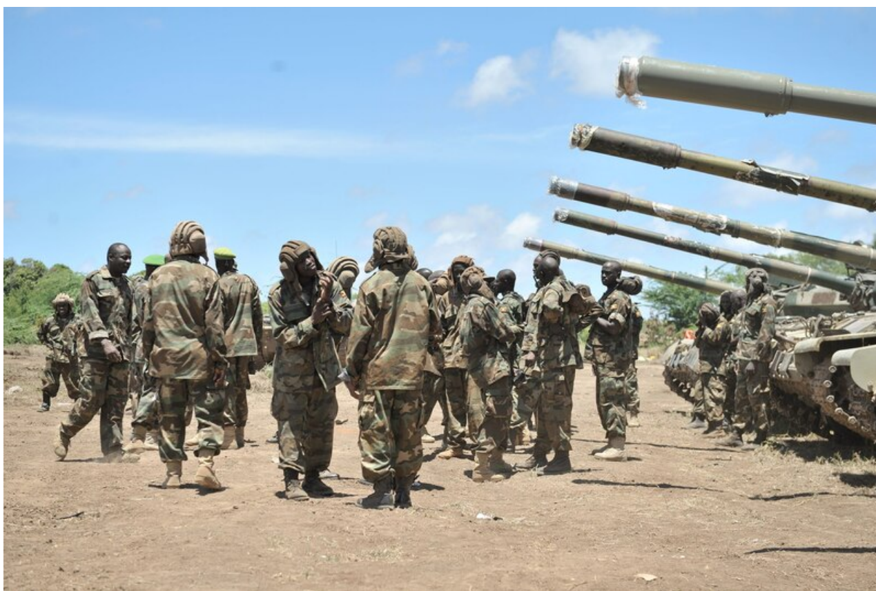
Foto: Ugandští tankisté z obrněné brigády stojí před svými stroji

Uganda disponuje také nadzvukovým letectvem, má k dispozici 5 víceúčelových letounů Su-30 a 5 stíhacích letounů MiG-21.