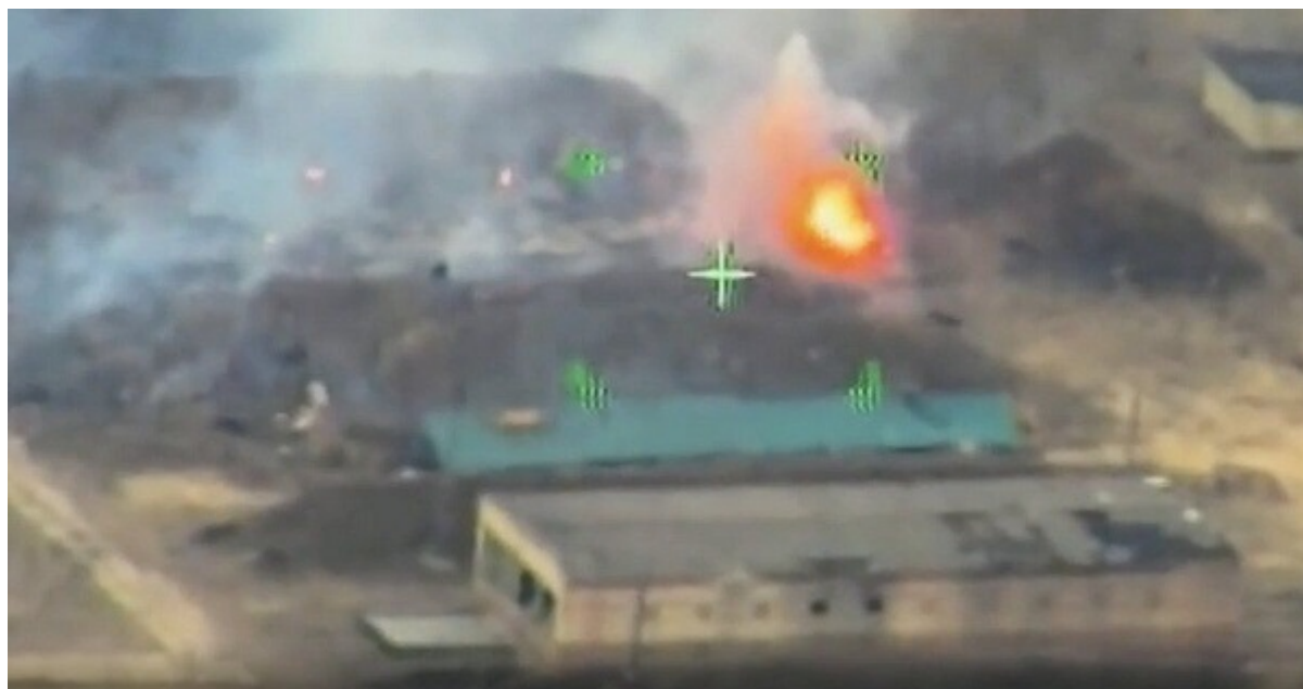
Snímek obrazovky ničení oblasti.