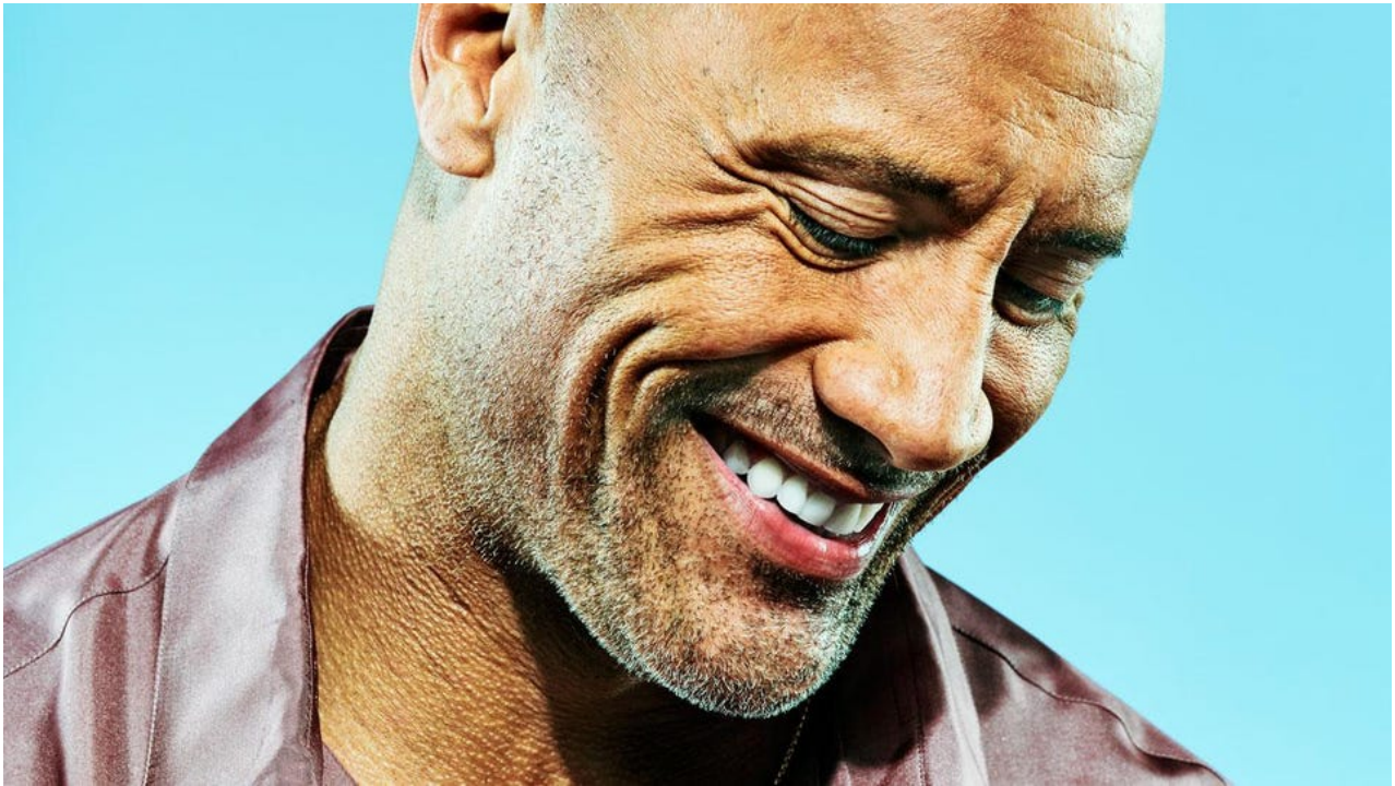
Dwayne Johnson at his Forbes photo shoot.