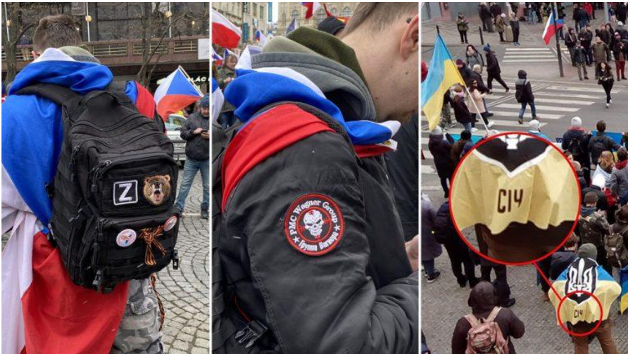
Extremistické symboly na protivládní demonstraci 12. 3. 2023

Na včerejší protivládní demonstraci svolané stranou Právo Respekt Odbornost (PRO) na pražském Václavském náměstí se objevily symboly ruských i ukrajinských extremistů. Po skončení akce část účastníků zaútočila na budovu Národního muzea, kde žádali sundání vyvěšené ukrajinské vlajky. Mezi zadrženými byl i účastník s písmenem Z na batohu, které používá ruská armáda během války na Ukrajině, a s logem ruské žoldnéřské Wagnerovy skupiny na rukávu. Na fotografiích z demonstrace je také možné vidět proukrajinského demonstranta s vlajkou Organizace ukrajinských nacionalistů.