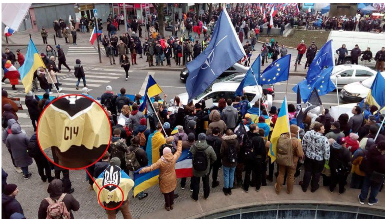
Stejná vlajka jako na předchozím obrázku, tentokrát je vidět spodní část vlajky s nápisem Січ.

Nápis Karpatska Sič může z hlediska historie odkazovat na Hnutí ukrajinských nacionalistů na Podkarpatské Rusi, které se původně nazývalo „Ukrajinská národní obrana“, později bylo přejmenováno