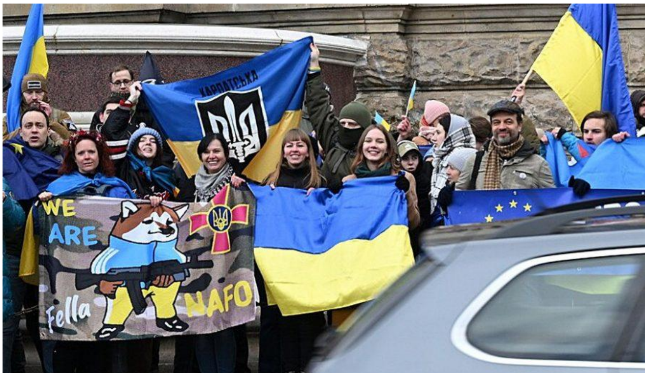
Výřez z fotografie ukazující proukrajinské demonstranty u Národního muzea. Na fotografii vlajka s logem Organizace ukrajinských nacionalistů a nápisem Карпатська