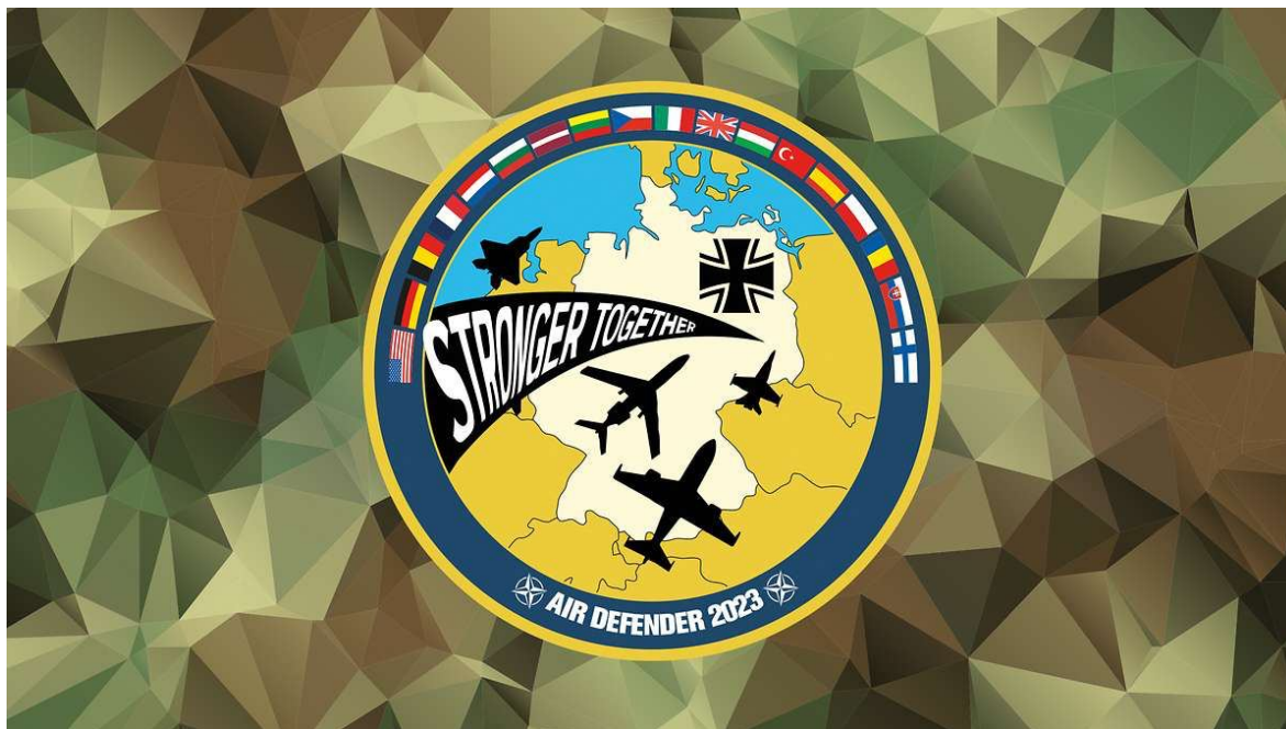
Logo cvičení (nahore) a grafika „cvičiřtě“ (dole)

NATO: „Air Defender“. Tento manévř se stovkami letadel a stíhaček už vzbuřuje mezi leteckými společnostmi obavy. Protože budou rozsáhlé řáky letů. Podle zasvěcených jsou aerolinky ve skutečné poplachové náladě.