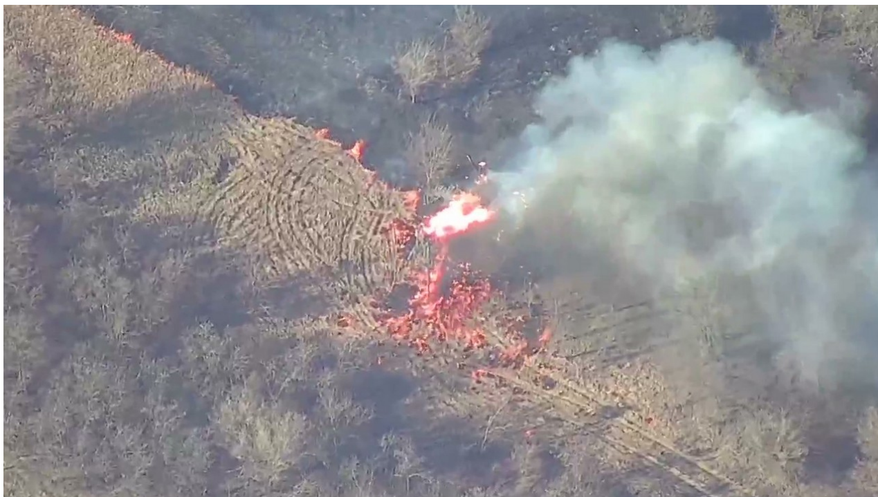
Palte kolem opuštěné M777 (c). Snímek z publikovaného videa

Zazněly záběry porážky dělostřeleckého postavení ukrajinských jednotek, na které byla umístěna 155mm tažená houfnice M777 americké výroby.