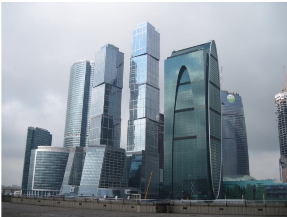
Moskevské Business City jako obraz růstu ruské ekonomické moci po nástupu Vladimira Putina od funkce prezidenta v roce 1999

Válka se vede o mamutí ruský paleát , tedy o ruský kontinent naplněný nerostným bohatstvím prakticky celé Mendělejevovy tabulky od A do Z. Rozškubat Rusko na menší části je nezbytné pro přežití tzv. tržního kapitalismu západního stříhu založeného na nekonečném růstu HDP. Růst HDP je obchodní značkou Londýnských kanceláří, je to to prototyp uchvácení moci nad celým světem skrze zadlužení všech států na této planetě.