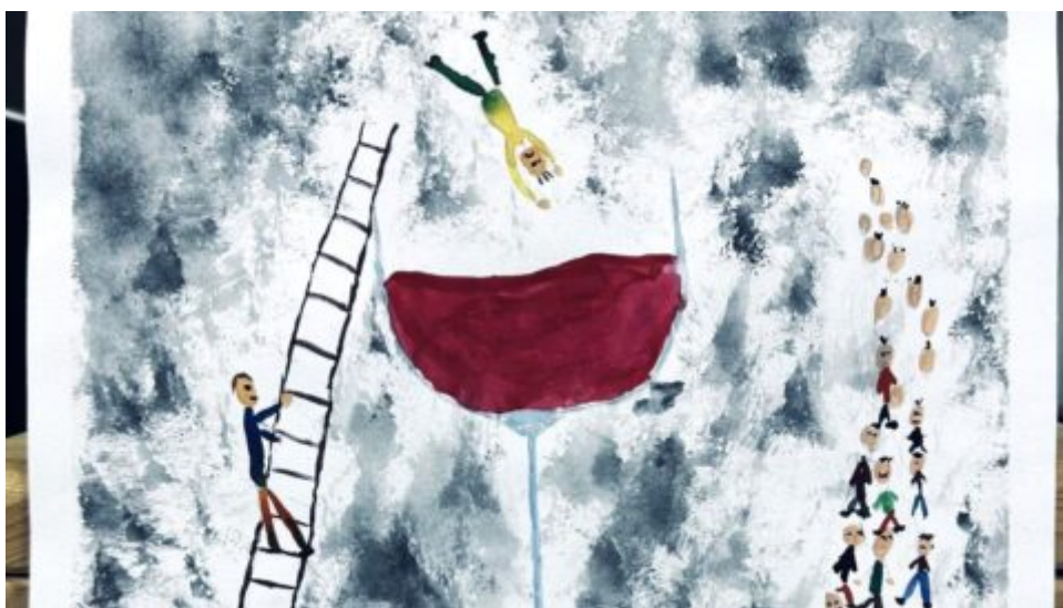
Nepít je umění? Policie ČR vyhodnotila kreativní výzvu „Suchej únor“ pro žáky škol