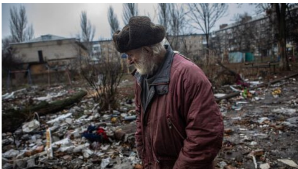
Bachmut – poslední zprávy z bojů podává česká válečná zpravodajka