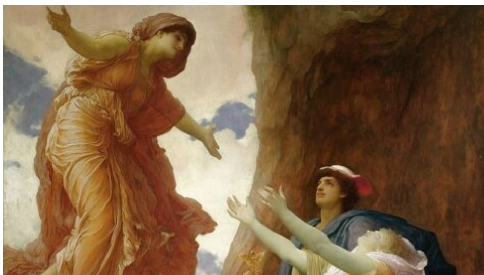
Příchod jara a Leightonův „Návrat Persefony“