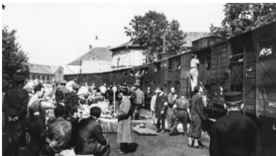
Památník ticha připomene největší jednorázovou masovou vraždu československých obyvatel