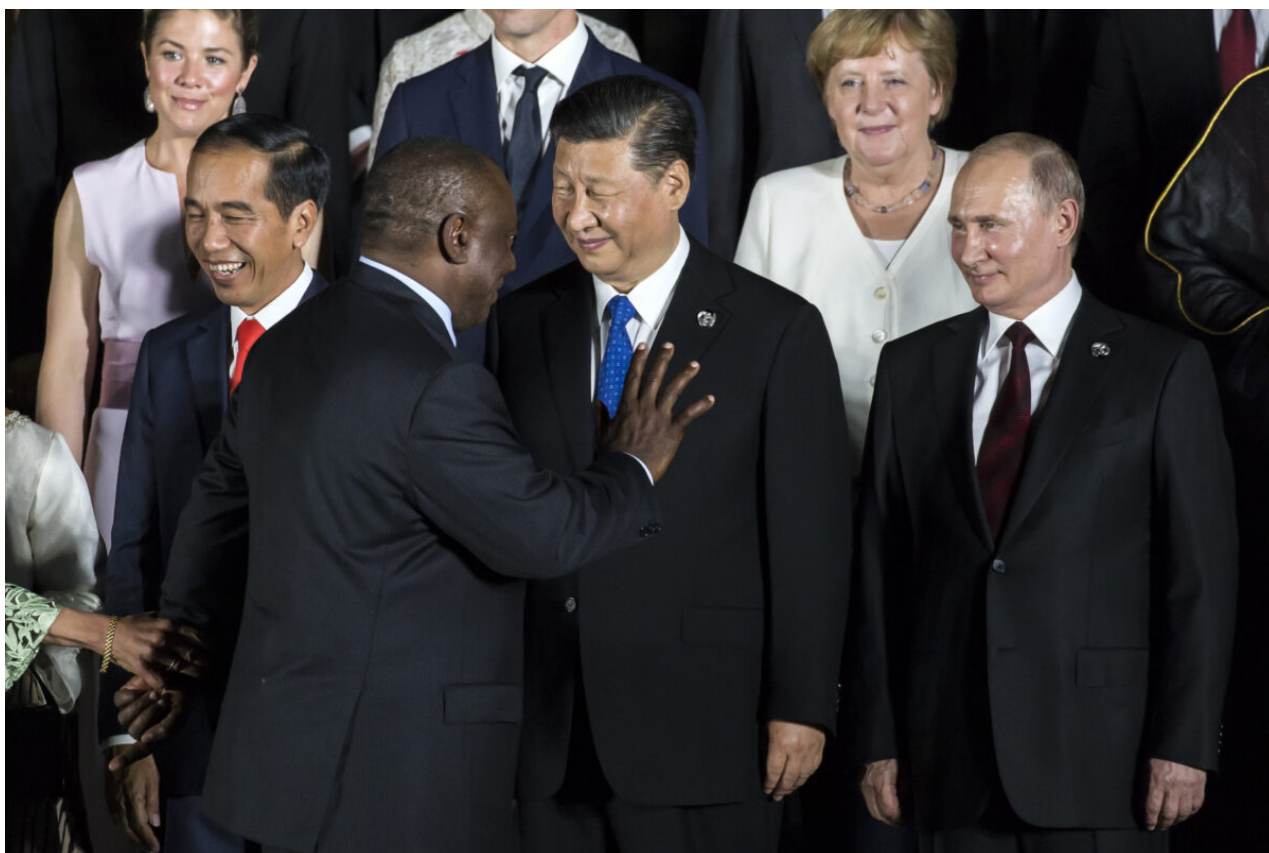
Jihoafrický prezident Cyril Ramaphosa zdraví čínského prezidenta Si Ťin-pchinga a ruského prezidenta Vladimira Putina během focení před Ósackým hradem na summitu G-20 v japonské Ósace, 28. června 2019.

Rusko zároveň neúnavně pracuje na podkopávání demokracie v Africe. Moskva se postavila proti arabskému jaru a barevným revolucím v severní Africe. Podporovala také pokusy Chalífy Haftara dosadit se na post vládcce Libye. V roce 2013 Rusko podpořilo puč generála Abdela Fattaha El-Sisiho, který měl svrhnout demokratickou vládu v Egyptě. Moskva rovněž podporovala vojenské vlády a převraty v Súdánu, Mali, Guineji a Burkině Faso. Ruská armáda navíc poskytuje ochranu vůdcům ve Středoafričské republice, kde se předpokládá, že se Kreml vměšoval do voleb v roce 2020.