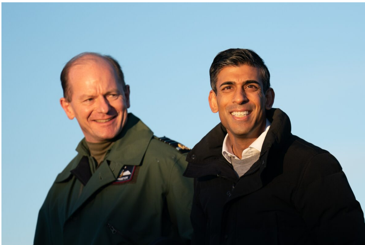
Hlavnř marřřal letectva Mike Wigston (vlevo) s premiřrem Rishi Sunakem břhem nřvřstřvy RAF Coningsby v anglickřm Linconshire 9. prosince 2022.

Ve střeďečnřm rozhovoru pro australskou rozhlasovou a televiznř spoleėnost (ABC) na leteckř vřstavř v australskřm Avalonu velitel vzdušnřch sil RAF sir Mike Wigston řekl: „Rozhodli jsme se, ře to zveřejnřme velmi hlasitř a jasnř, ře je to nepřijatelnř a ře je to nřco, na co jsme připraveni Āinu veřejnř upozornit.“