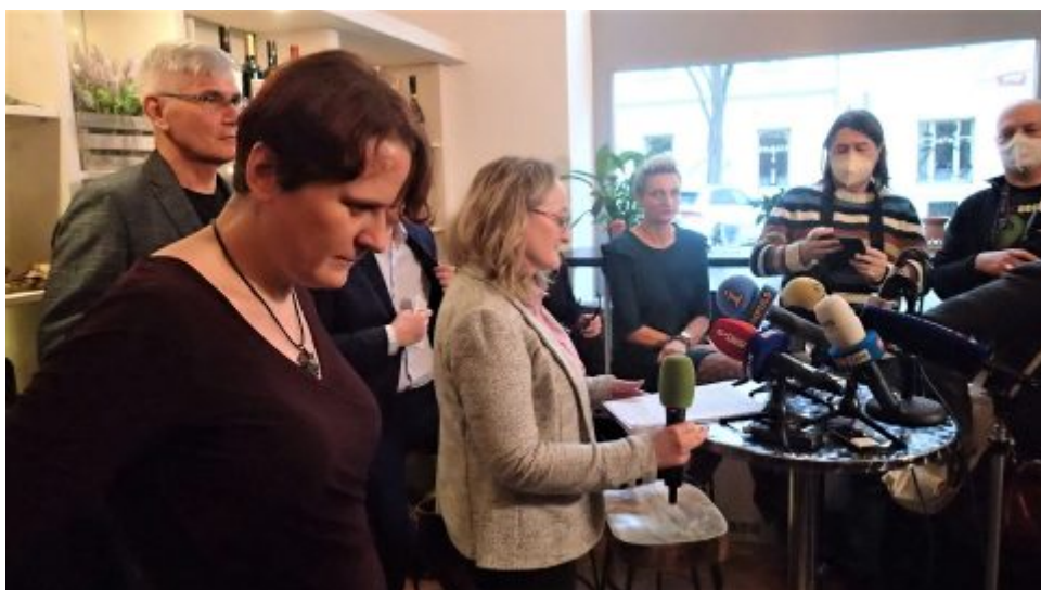
Online přenos tiskové konference – Velké covidové mlčení