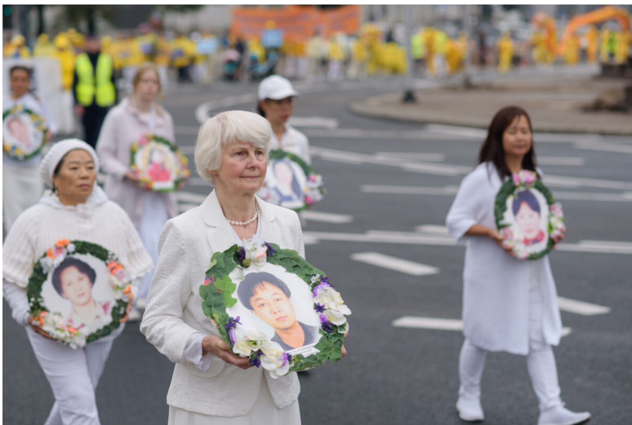
Praktikující Falun Dafa nesou snímky obětí pronásledování v Číně během pochodu centrem polské Varšavy, 9. září 2022.

„Soudy navíc ani nezmínily, natož aby se podrobně zabývaly dopadem zákazu na práva stěžovatelů podle článků 9 a 10 Úmluvy ... a nezházily tak jejich práva ve srovnání s veřejným zájmem,“ dodal soud s odkazem na části chránící svobodu projevu a slova ( pdf ).