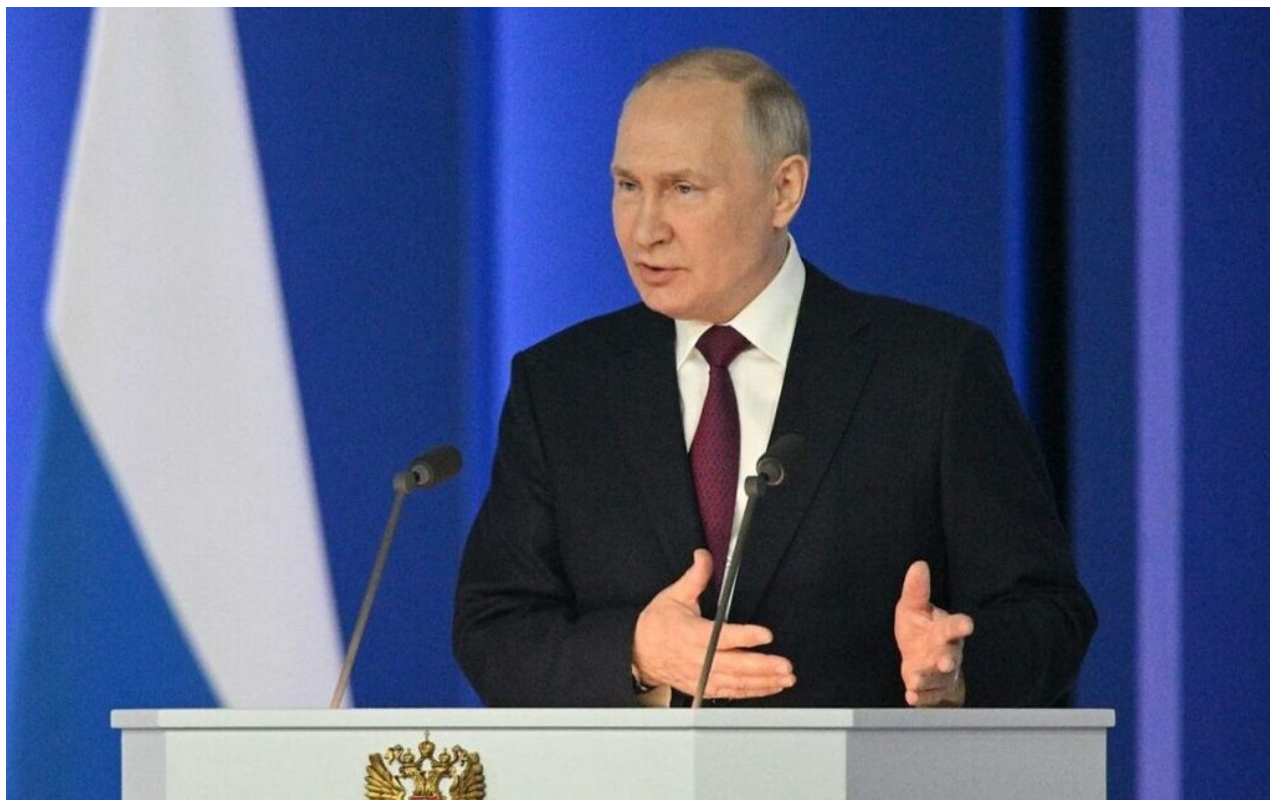
Vladimir Putin při projevu o stavu federace, 21. února 2023

Hitlera dostaly k moci národy zemí západní Evropy a v žoldu tohoto západního narativu se do války s Ruskem chystá Evropa i dnes. Je to stejný nacisticko-fašistický narativ, je to zvuk stejných bubnů, je to řev politiků proti Rusku, je to řev do války s Ruskem, je to řinčení zbraněmi s cílem mobilizovat obyvatelstvo a když nebude ochotno bojovat proti Rusku, tak to obyvatelstvo nejprve odvedou do týlu fronty na kopání zákopů, a když se člověk pokusí přeběhnout k Rusům, tak ho zastřelí do zad, jako se to děje teď Ukrajincům násilně odvedeným na frontu, kteří se chtějí dostat do Ruska a zachránit si život.