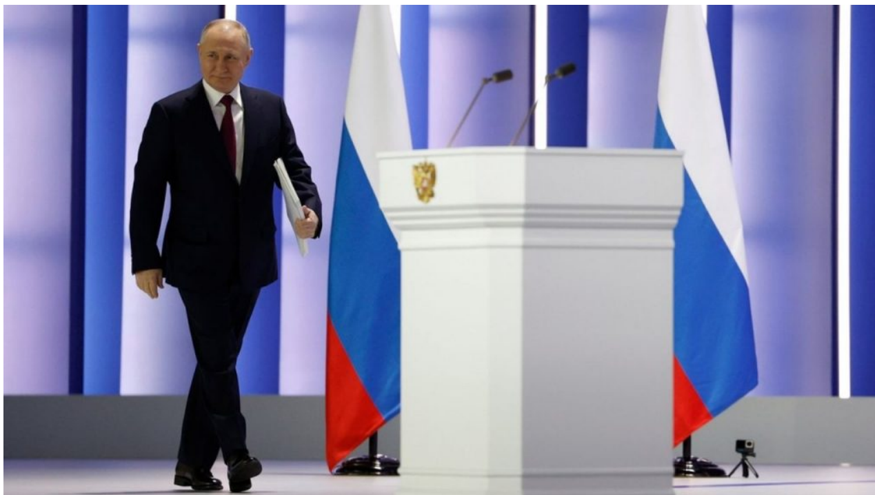
Vladimir Putin při projevu o stavu federace, 21. února 2023

takovým nenasyčeným prostorem je v dnešní době už jen jediná země, a to je Rusko. Představa jeho rozbití na desítky menších států podle modelu rozmlácené Jugoslávie na počátku 90. let je přesně tím plánem sionistů z Londýnských kanceláří.