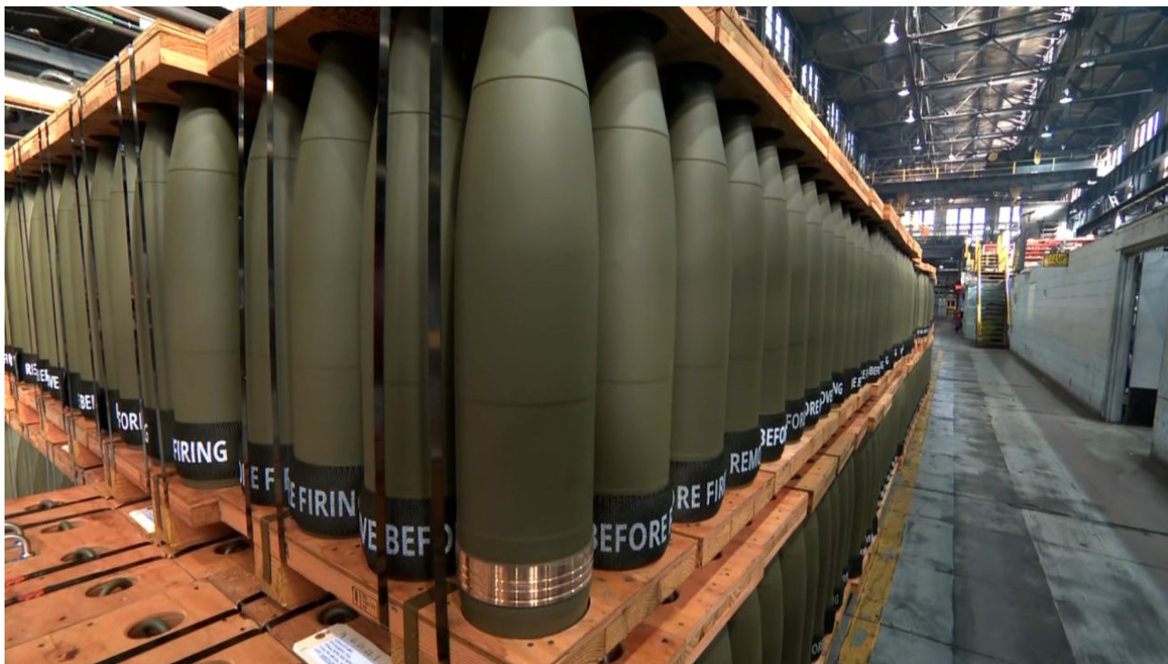
Stojany 155mm dělostřeleckých granátů v zařízení Scranton

Americká televizní stanice CNN ukazovala podnik, kde se vyrábějí tisíce 155mm dělostřelecké munice, a hovořila o programu převedení podniků na stanné právo, aby byla uspokojena poptávka po granátech.