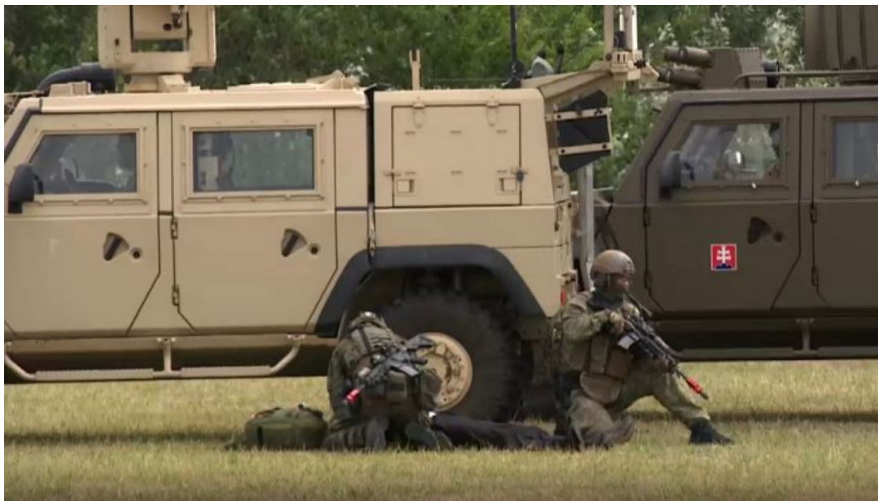
Cvičení slovenské armády

Z centrálního registru řidičských průkazů totiž nejde zjistit, jestli je řidič aktivní nebo pasivní. Při mobilizaci už není čas zjišťovat, jestli člověk umí řídit nákladák, anebo ho má jenom napsaný v řidičáku, ale naposledy nákladák řídil v autošcole před 30 lety. Rovněž armádu zajímají muži, kteří pracují jako kuchaři a řezníci. Mapa rovněž zaregistruje i pracovníky ve stavebnictví a v montážním průmyslu, protože při mobilizaci bude probíhat řada stavebních a montážních činností.