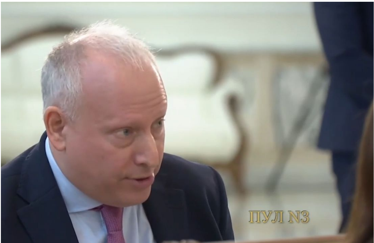
Redaktor BBC Steve Rosenberg

Rozdělení Ukrajiny je v podstatě Plán B ze strany Londýnských kanceláří. Je to varianta, že se nepodaří destabilizovat Kreml a svrhnout vládu Vladimira Putina, takže bude potřeba zajistit, aby Kreml nakonec nevzal celou Ukrajinu. A k tomu má sloužit právě Polsko a plán na vstup polských vojáků na Ukrajinu ve velkých počtech, které mají mít oficiálně status mírových vojsk, které mají sloužit jako blokace NATO proti postupu ruských vojsk. Poslední události z Donbasu ukazují, že ruský generální štáb přímo zevnitř zpomaluje vojenské operace s cílem prodloužit válku a více vyčerpát západní zbrojní sklady.