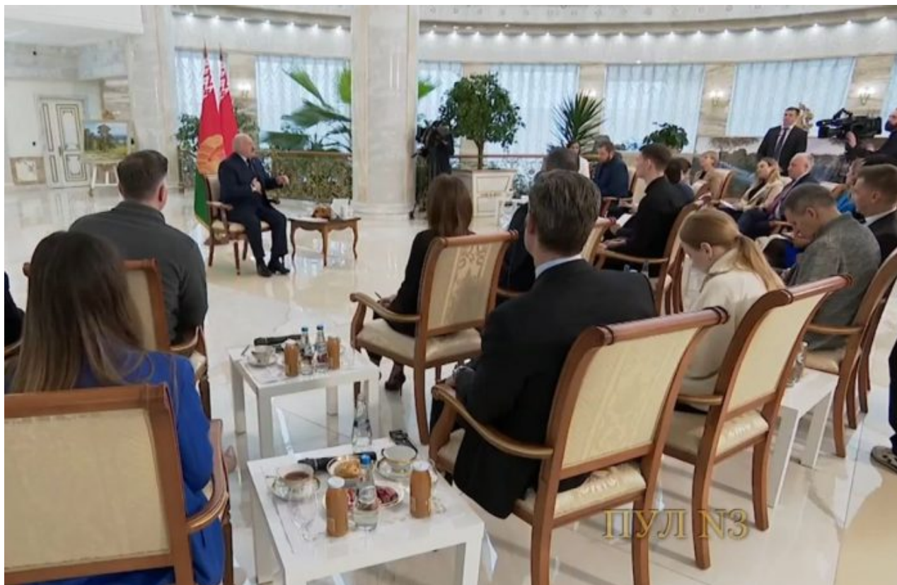
Tisková konference Alexandera Lukašenka

Ta hrozba je tak vysoká, že Lukašenko už otevřeně uvažuje o invazi na Ukrajinu s cílem zajistit integritu Ukrajiny na západě v prostoru Haliče. Lukašenko potřebuje své casus belli pro odůvodnění pro připojení Běloruska do SVO na Ukrajině po bok Ruska, a právě útok běloruských opozičníků proti Lukašenkově vládě po jejich návratu z bojů na Ukrajině se jeví jako nejlogičtější casus belli pro vstup Běloruska do války na Ukrajině.