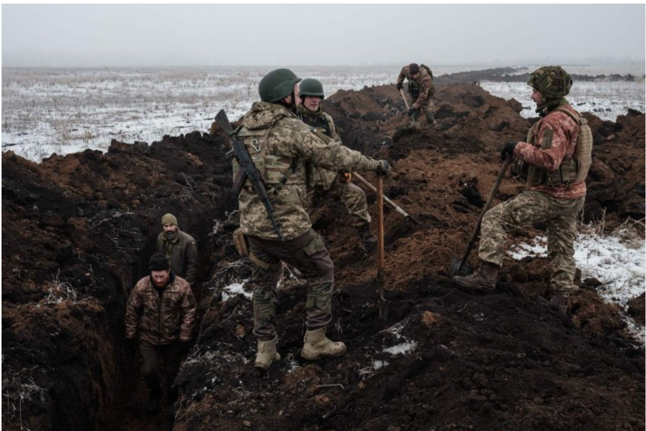
Ukrajínští vojáci odpočívají, když dělají příkop poblíž Bakhmutu. Ukrajínští vojáci odpočívají, když 1. února dělají zákop poblíž Bakhmutu.

Předplatitelé FP nyní mohou dostávat upozornění, když jsou zveřejněny nové příběhy napsané těmito autory. Přihlásit se nyní | Přihlásit se