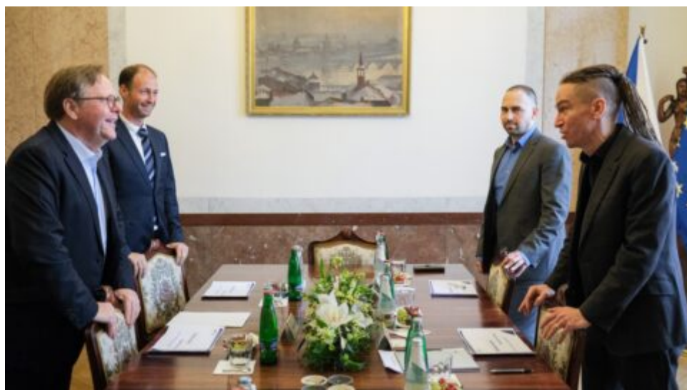
Ministr Bartoš jednal se šéfem Erste Group o prioritách české vlády v oblasti bydlení