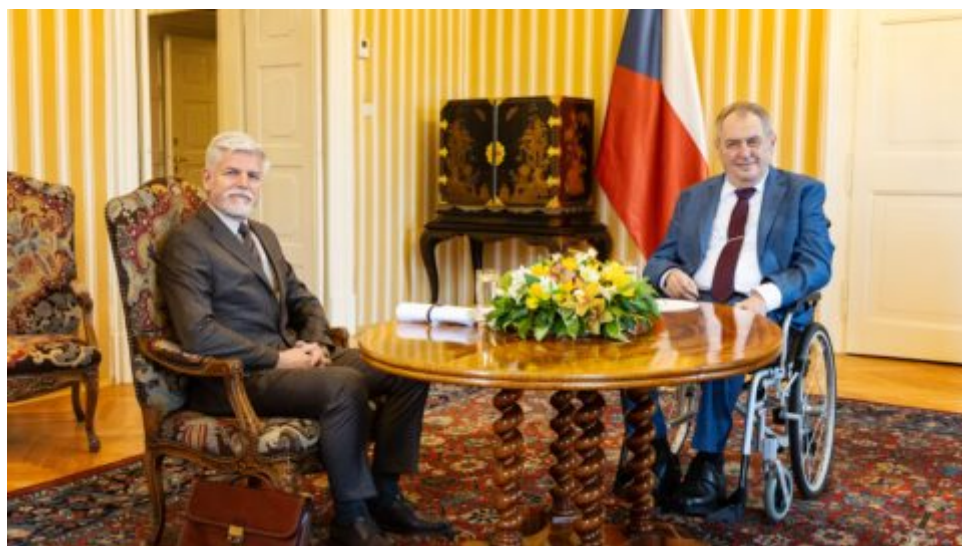
V Lánech se uskutečnila schůzka obou prezidentů ČR