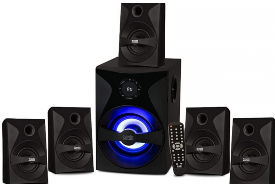
systém prostorového zvuku Amazonka