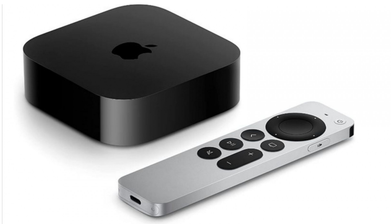
Přehrávač médií Apple Amazonka

Přehrávač médií je místo, kde začíná skutečná zábava; budete si moci vychutnat své oblíbené televizní pořady a filmy v mžiku oka s přehrávačem médií integrovaným do systému domácího kina.