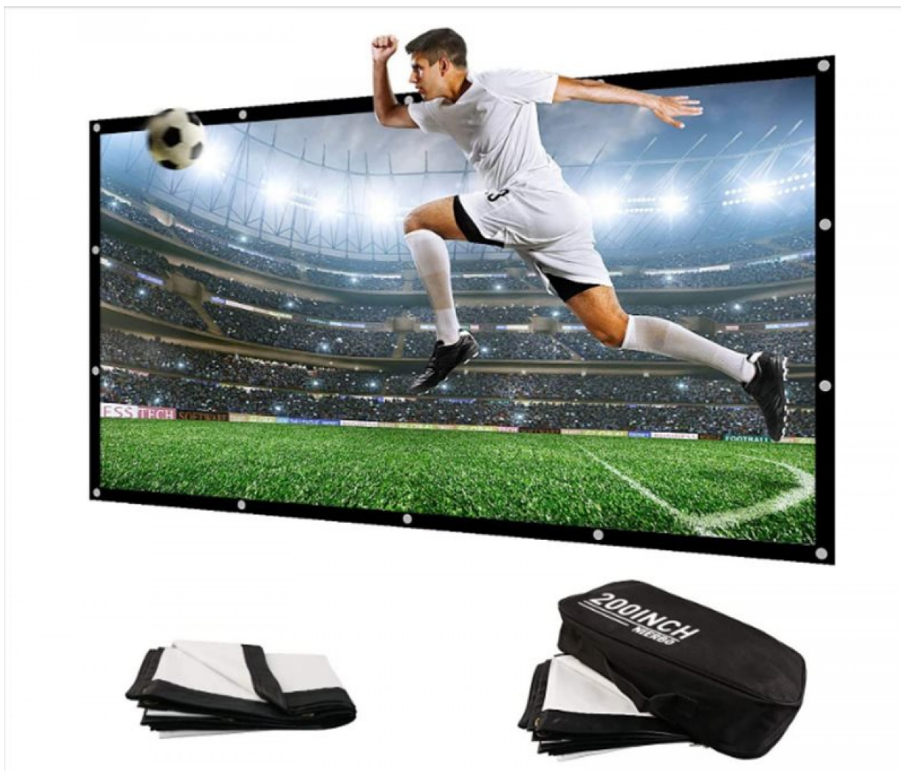
Obrázky, které vyskakují Amazonka

Existuje několik prvků, které rozhodnou o tom, zda váš systém domácího kina poskytne přesně ten typ zážitku, který hledáte. Displej je na vrcholu tohoto seznamu. Je to korunovační klenot vašeho systému domácího kina.