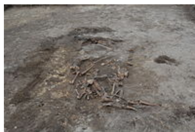
Ve Wola Ostrowiecka objeven hromadný hrob obětí UPA