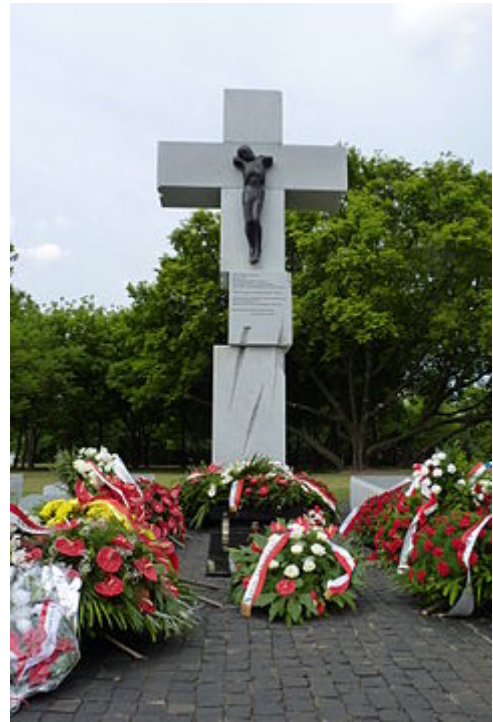
Pomník obětem zločinu spáchaného na polských občanech v Kresy OUN-UPA ve Varšavě