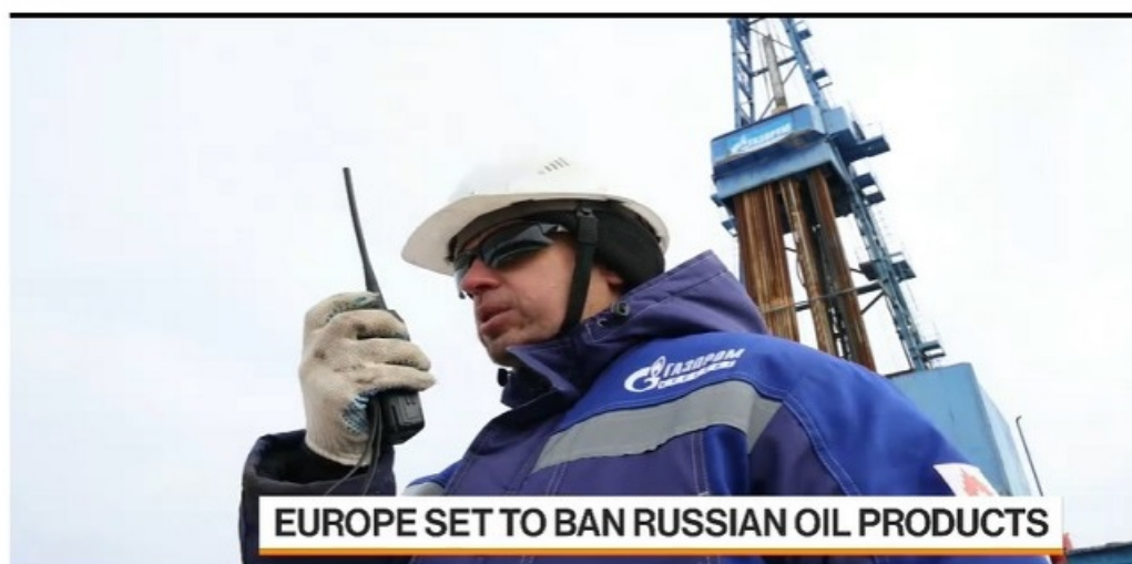
EU Import Ban on Russian Oil Products Starts Sunday

Bylo obtížné vysvětlit koncem minulého roku, proč USA znatelně začaly snižovat tlak na Indii, aby se distancovala od Ruska, ale v té době se mělo za to, že to bylo jednoduše opožděné uznání geostrategické reality a bylo to děláno z důvodu pragmatismu, aby si zachovaly svou strategické vazby. Nyní se však zdá, že nepostradatelná role Indie na globálním energetickém trhu jako prostředníka při usnadňování nyní tabuizovaného rusko-západního obchodu s energií hrála roli v rekalibraci politiky USA.