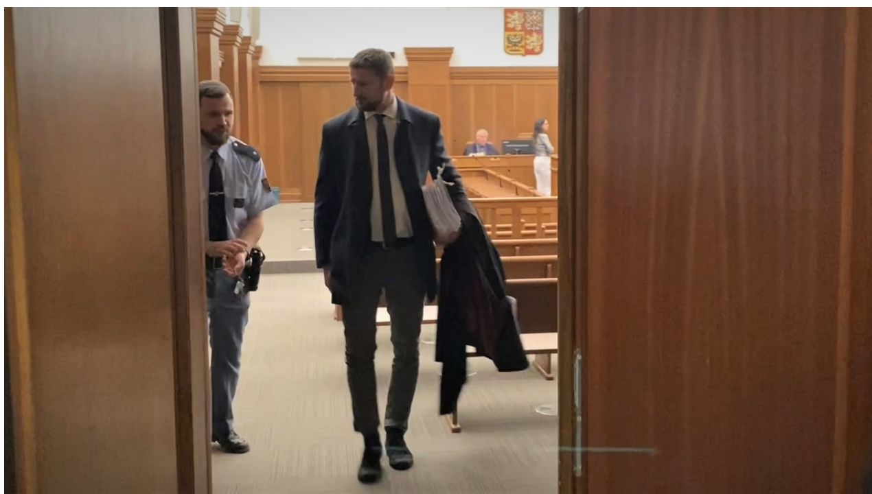
Státní zástupce Mgr. Vít Legerský vychází ze soudní síně.