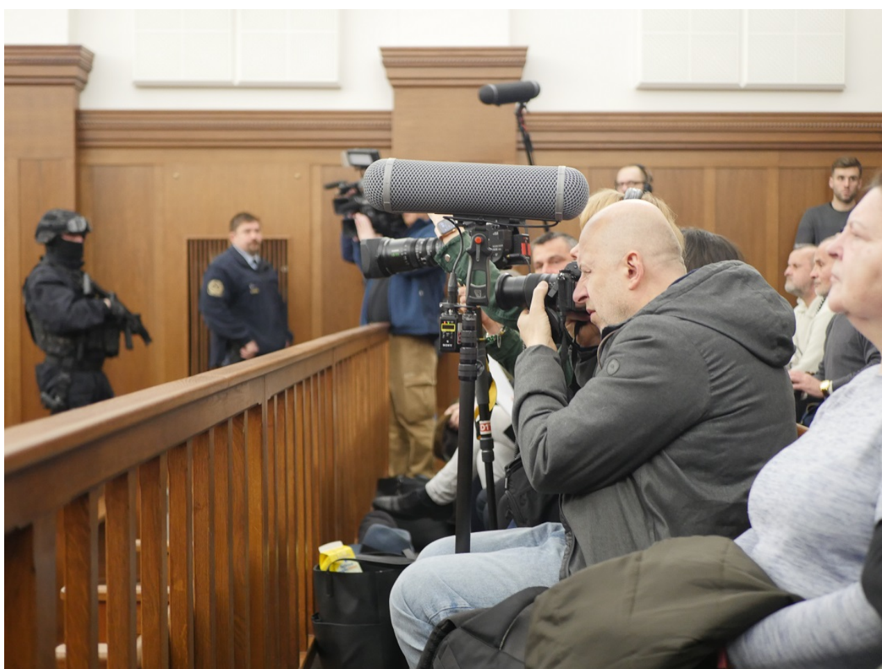
Média v soudní síni.