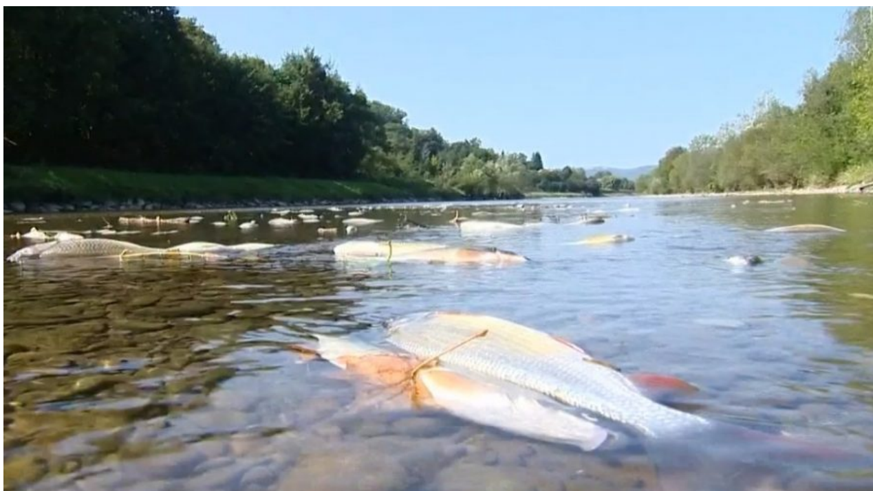
Uhynulé ryby v řece Bečvě, konec září 2020.