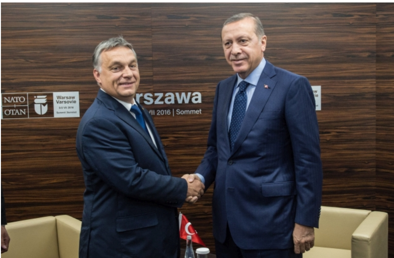
Viktor Orbán a Recep Tayyip Erdogan

Švédské úřady tak daly povolení k pálení tureckého Koránu. Odezva Ankary se dala přirovnat k explozi vzteku a k rozlomení vztahů s USA, které nebyly nijak dobré od nepovedeného převratu v Turecku v roce 2016, ale to nebylo nic ve srovnání s tím, co se děje teď. Ministr vnitra přímo narovinu obvinil amerického velvyslance z přípravy státního převratu v Turecku.