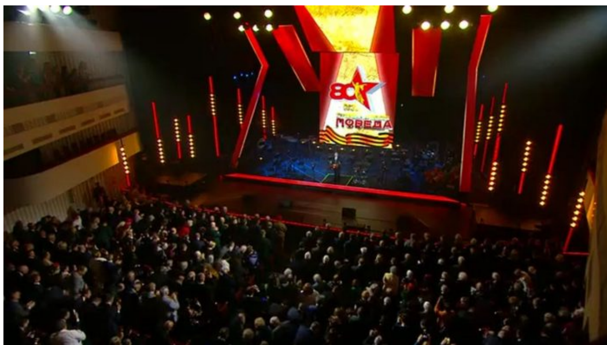
Projev probíhal v divadle ve Volgogradu

Mnoho lidí to stále nevidí, nebo spíš nechce vidět, ale nejen česká vláda, ale vlády většiny zemí EU dělají vše pro zatažení Evropy a NATO do přímého konfliktu s Ruskem, doslova je to do očí bijící útěk evropských politiků vstříc válce s Ruskem, doslova o to usilují a připravují novely zákonů, ale sami se bojí do té války jít, a proto si dali do novel výjimky, na koho se mobilizace vztahovat nebude, na poslance, senátory, na vládu, na strážníky, na europoslance! Chápete? Oni ženou nás obyčejné lidi do války, ale sami si do zákonů dají, aby jich se to netýkalo. Víte, co to znamená?