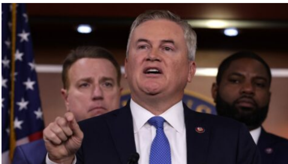
Předseda sněmovního výboru USA pro dohled se zaměřuje na „zneužívání vlivu“ ze strany rodiny Bidenových