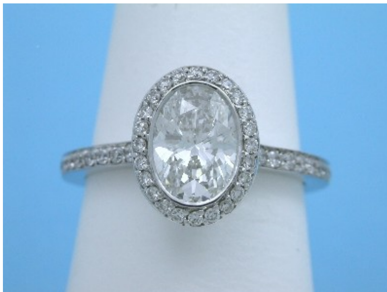
Bez Ambar Designer Bezel-Set Oval Diamond Ring