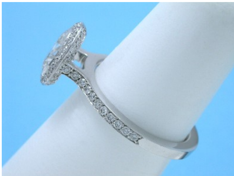
Designový diamantový zásubní prsten Oval Cut and Pave Bez Ambar

© 2000 - 2020 Diamond Source of Virginia, Inc. | Všechna práva vyhrazena