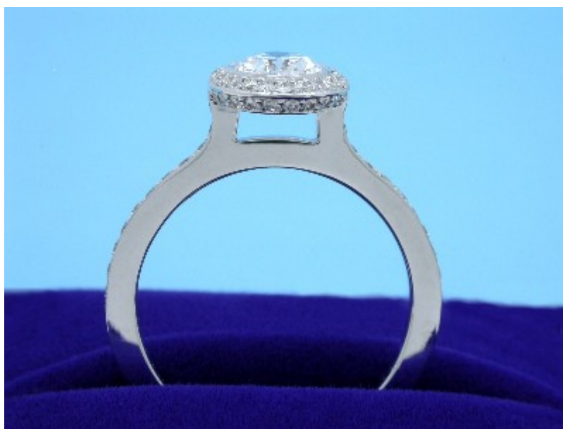
Vlastní Bez Ambar 18karátové bílo-zlaté ostří nože uchycení ve stylu pave

Můžete nás kontaktovat telefonicky na našem bezplatném čísle (888) 477-8385, zanecháním zprávy v poli Otázky vpravo na každé stránce nebo vyplněním formuláře žádosti v poli Diamond Search napravo od každé stránky. strana. Nezapomeňte nám sdělit, jaký je tvar, karátová hmotnost a popis pro styl prstenu, který vás zajímá.