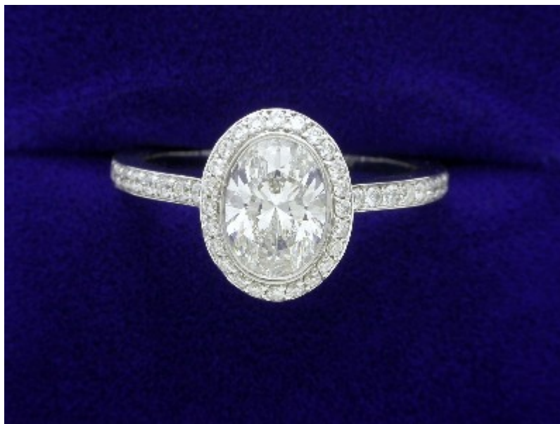
Oválný diamantový prsten: 1,00 karátů s poměrem 1,38 v 0,39 tcw Bez Ambar montáž na dlažbu

diamondsourceva.com/Diamonds/OvalCutRings/Oval-Cut-1.00ct1.38ratio0.39paveBezAmbar.asp