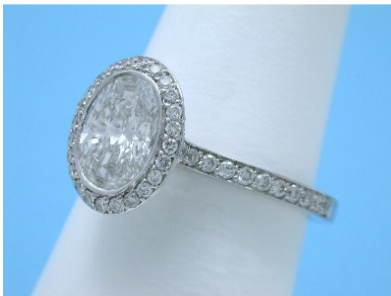
Vlastní Bez Ambar 18karátové bílo-zlaté ostří nože uchycení ve stylu pave