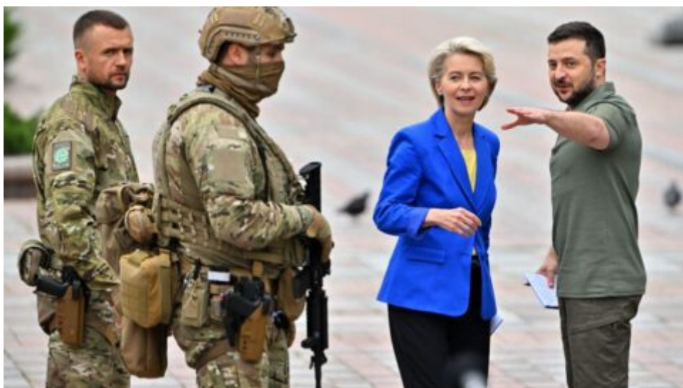
Zelenskyj odvolává vysoce postavené politiky.