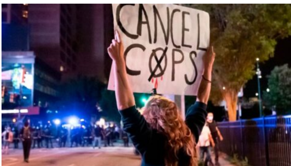
Guvernér Georgie vyhlásil nouzový stav kvůli protestům, povolává 1 000 členů Národní gardy.