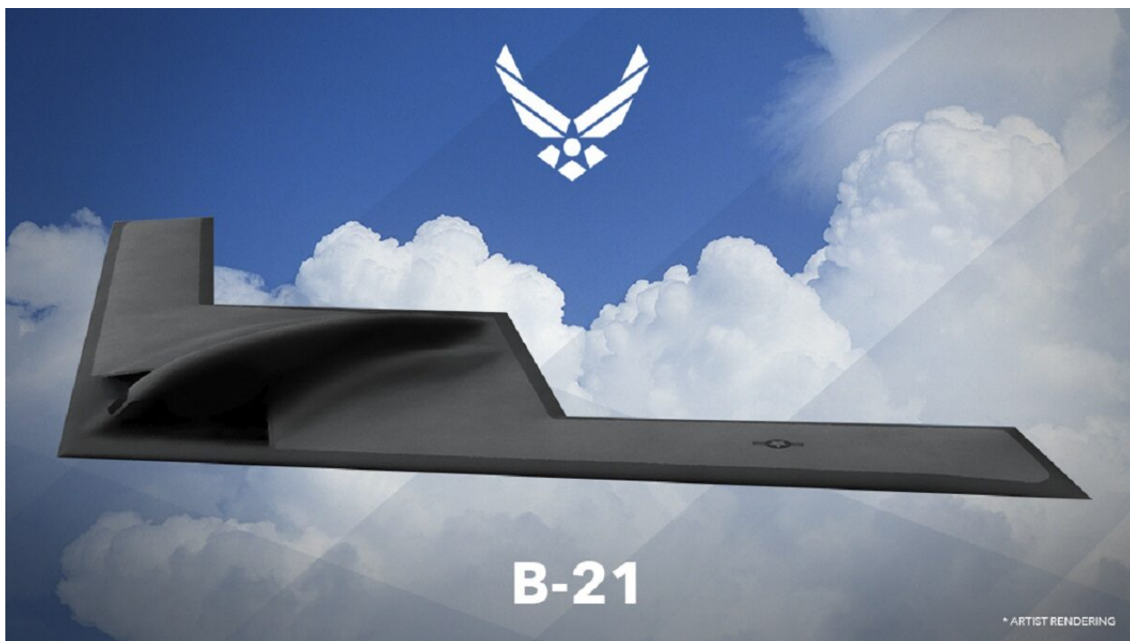
Grafika amerického letectva bombardéru B-21.

„[KS Číny] pronikla do naší země natolik, že nyní nakupuje půdu. A možná tuto půdu kupují ne nutně proto, aby na ní pěstovali potraviny, ale proto, aby se dostali do blízkosti některých našich národních základů bezpečnostních sil, v jejichž blízkosti by neměli mít žádnou logistickou volnost,“ řekla Noemová.