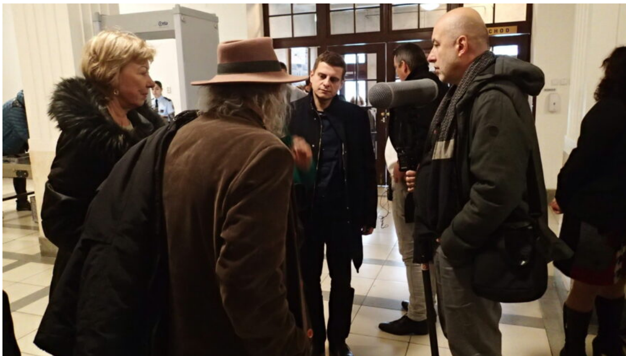
Zástupci Spolku Šalamoun rozmlouvají na chodbě Ostravského krajského soudu, 1. prosince 2022.