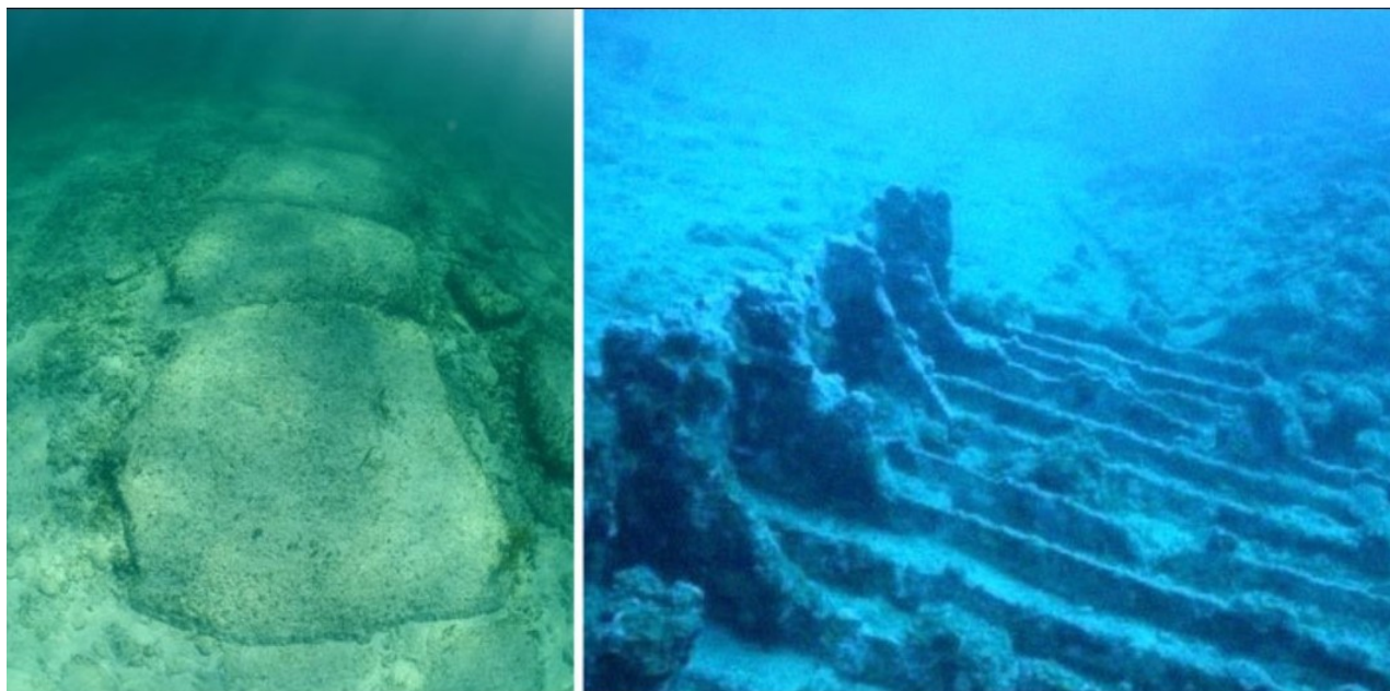
Bimini Road podvodní silnice na dně oceánu poblíž Baham

Jeden tábor se obejde bez konvenční moudrosti, že vyspělá civilizace se objevila asi před 5 000 lety a tvrdí, že 12 000-19 000 let stará podvodní „silnice“ je vytvořena člověkem.