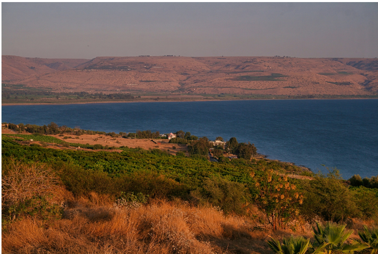
Galilejské jezero v Izraeli

Na dně izraelského jezera Kinneret, známého také jako Galilejské jezero, leží masivní, záhadná stavba, která může být stará více než 9 500 let.