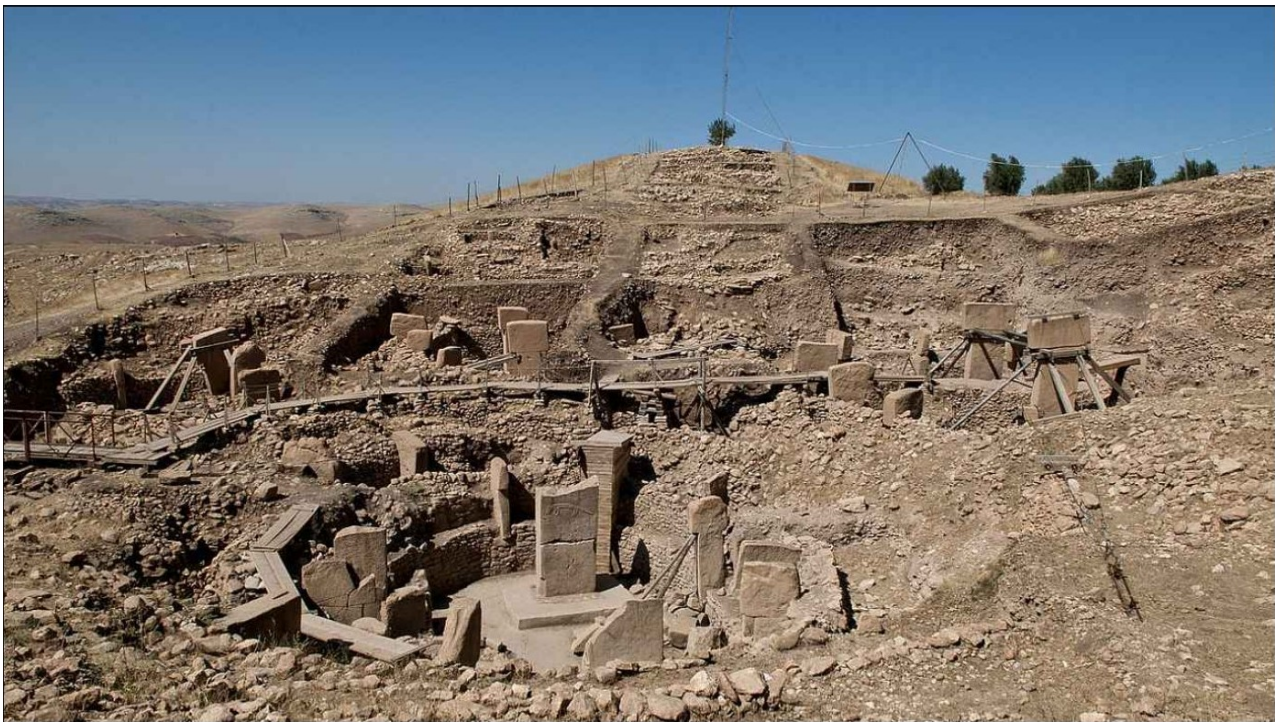
Archeologická památka Gobekli Tepe