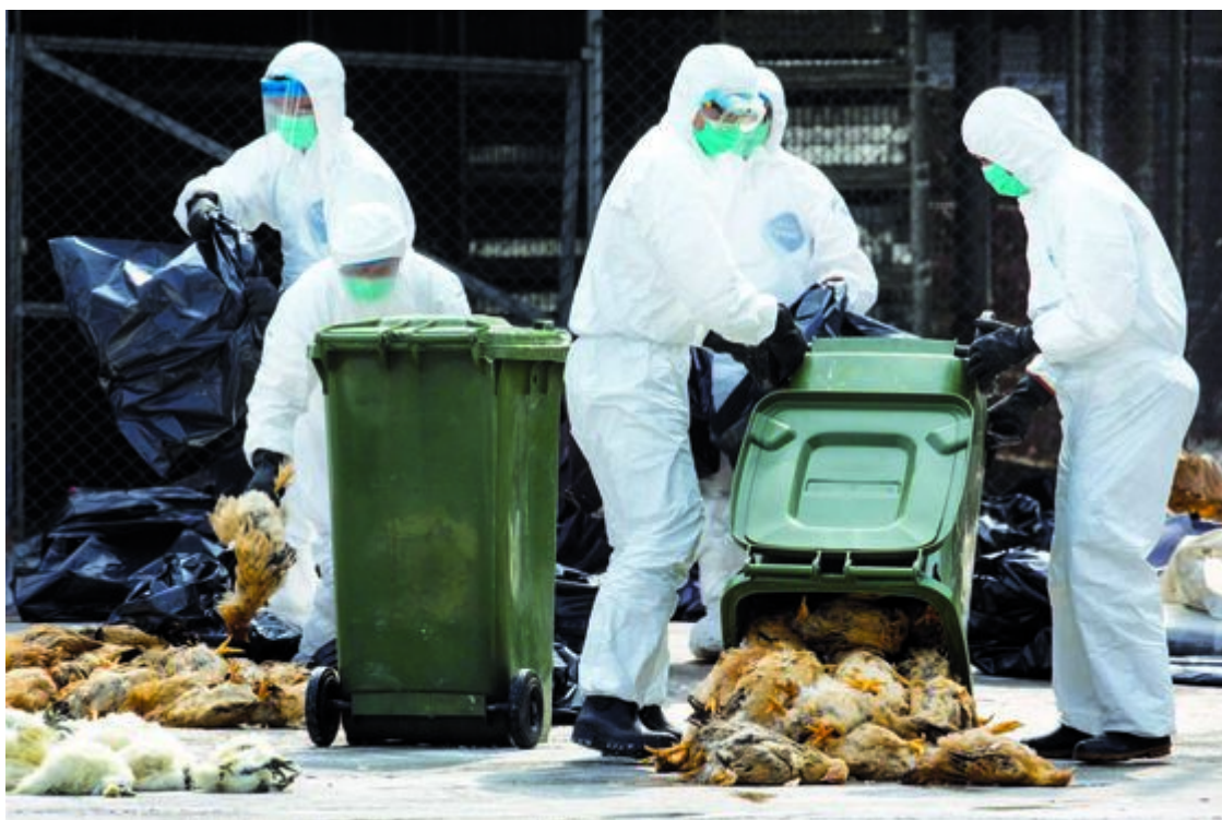
Foto je z Hongkongu, u nás je to podobné

Poslední měsíce, v podstatě od podzimu minulého roku, dochází v Evropě k systematickému masivnímu vybíjení kuřat. Mantra je vždy stejná. Řadí prý kuřecí pandemie – ptačí chřipka způsobována (pravděpodobně uměle vytvořeným) virem H5N1. Podle Wikipedie se virus objevil poprvé ve Skotsku v roce 1959: Vyznačuje se nejen vysokou nakažlivostí, úmrtností a rychlým šířením ptačí populací, ale také schopností infikovat a usmrtit člověka.