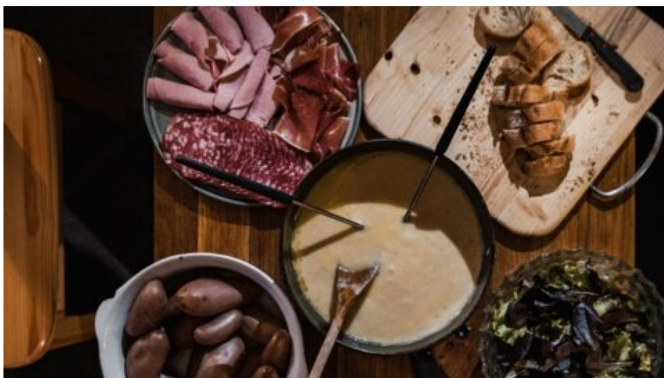
Fondue – sýrový pozdrav ze Švýcarska