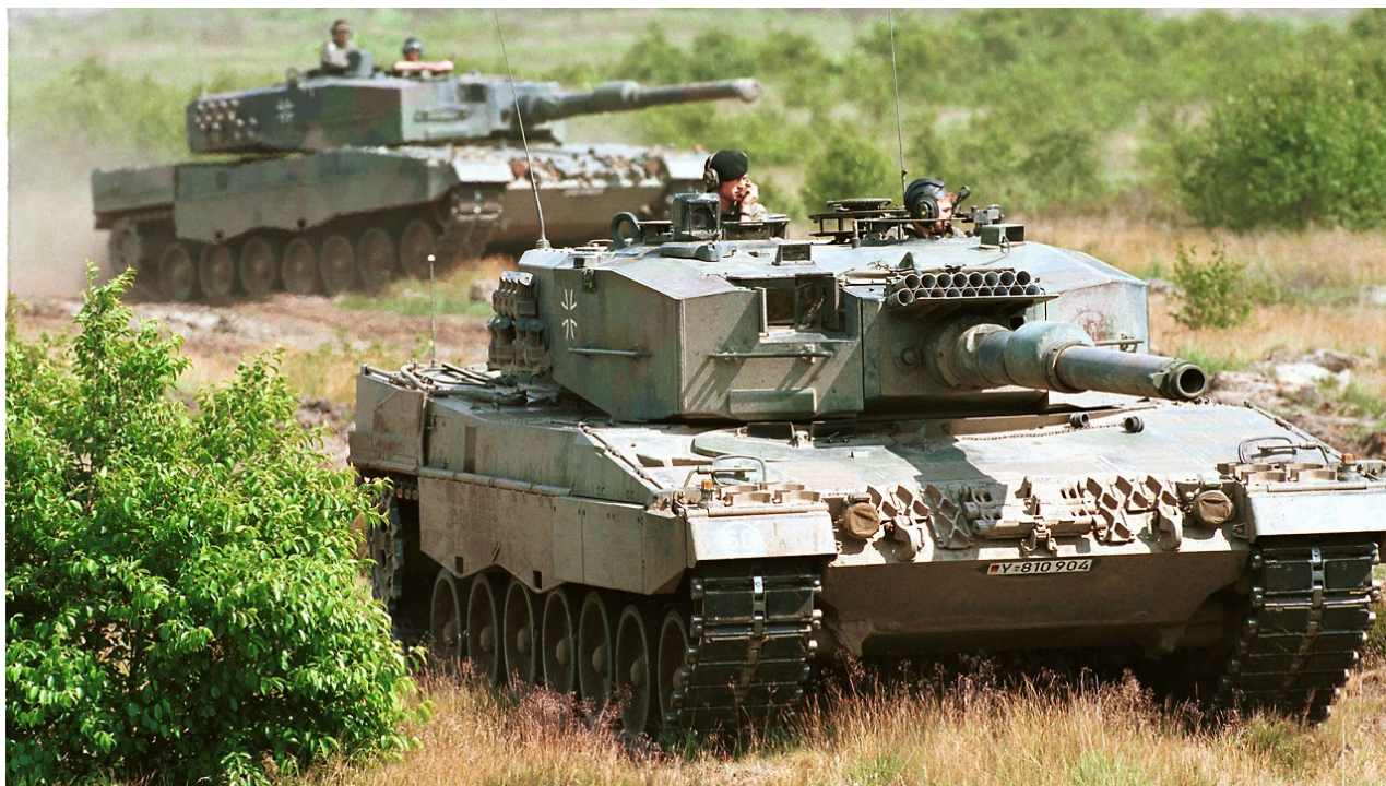
Tanky Leopard 2A4 německé armády.

Termíny pro zotavení ze skladu a přípravu k provozu bojových vozidel jsou následující - u BMP Marder je tato doba od 6 do 8 měsíců, u tanků Leopard bude procedura trvat minimálně 1 rok.