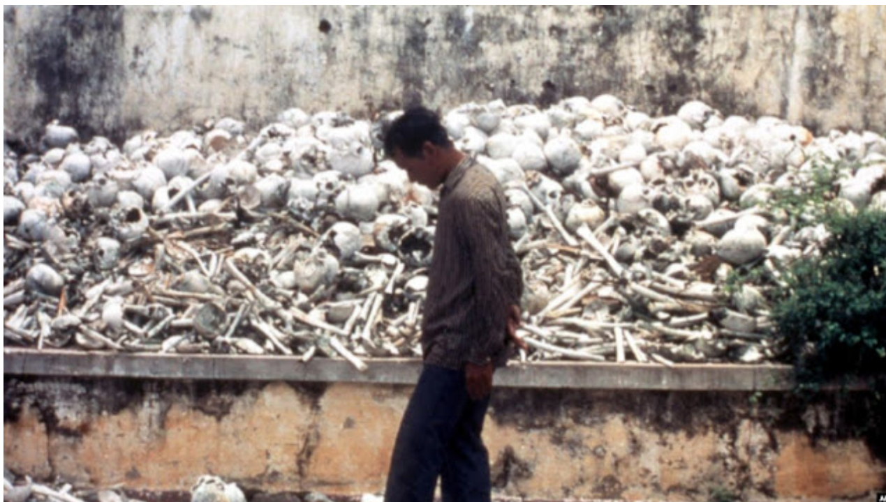
Následky šílenství Rudých Khmerů