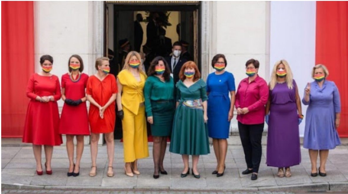
As foreigners spread destructive and anti-Christian anal activities in Poland, the women of the country take a stand against the nation and against God and Jesus Christ.

Jedním z problémů komunismu ve 20. století bylo, že většinou zasáhl společnosti, které neprošly kapitalisticko-průmyslovou revolucí. (Jak se ukázalo, etablovaný kapitalismus se ukázal být nekonečně přizpůsobivý při plnění masových požadavků, rozptyloval masy chlebem a cirkusy a/nebo kupoval radikály se sinekurami v systému.) Několik výjimek bylo východní Německo, Československo a do jisté míry Maďarsko. Není divu, že komunismus byl v těchto národech nejméně krvavý (i když zdaleka ne bez krve). Ale v zemích, kde musel být komunismus použit jako stavební nástroj průmyslu, to muselo být krvavé, v neposlední řadě kvůli tlakům ze strany kapitalistických/imperialistických národů. Koneckonců, ruský komunismus byl obklíčen kapitalistickými mocnostmi, které svého času dokonce poslal vojáky do Ruska (jako USA a jejich spojenci jsou dnes v Sýrii), aby potlačili revoluci v zárodku. Takže panoval pocit, že pokud Rusko rychle nevybuduje průmysl, bude zničen. To, co kapitalistickým národům trvalo jedno století, než se vyvinuly, muselo být provedeno za desetiletí nebo dvě, a to vedlo k použití masového nátlaku a dokonce státního otroctví. Ruský komunismus, který zdaleka nezdědil hořké, ale bohaté plody kapitalismu, by musel pěstovat průmyslový strom. O Číně to bylo ještě pravdivější, že v