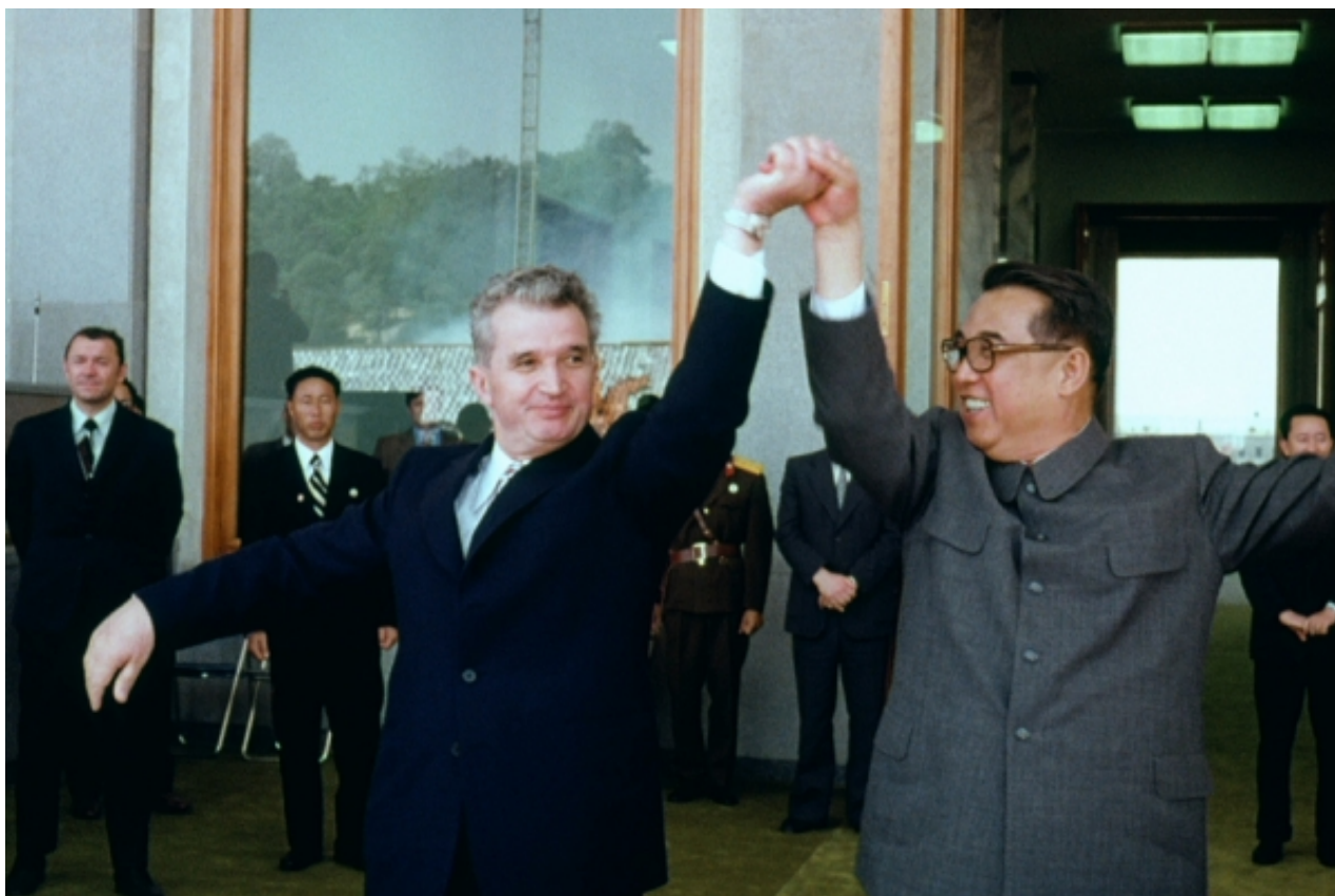
Ceausescu a Kim Ir-Sena

Ti na „pravici“ odsoudili nedávné „probuzené“ davy, násilníky BLM a antifašiangy jako „komunisty“ a podobně, a mezi jejich bláznivými a radikálními excesy za komunismu, zejména během kulturní revoluce v roce Čína. Ale pokud jde o obrazoborectví, ani křesťané a