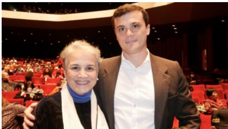
Shen Yun navrací světu to, co bylo ztraceno, říkají diváci v Houstonu