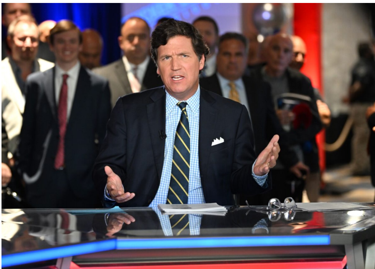
Moderátor Fox News Tucker Carlson hovoří během udílení cen FOX Nation Patriot Awards 2022 v Hollywoodu na Floridě, 17. listopadu 2022.

„Vždy budu bojovat proti nevoleným byrokratům, kteří se snaží indoktrinovat obyvatele tohoto státu tím, že porušují naše ústavní právo na svobodnou a otevřenou diskusi,“ prohlásil Bailey.