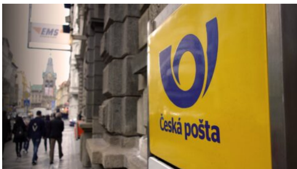
Česká pošta je strategický podnik, který však není v dobrém stavu, říká ministr vnitra Rakušan