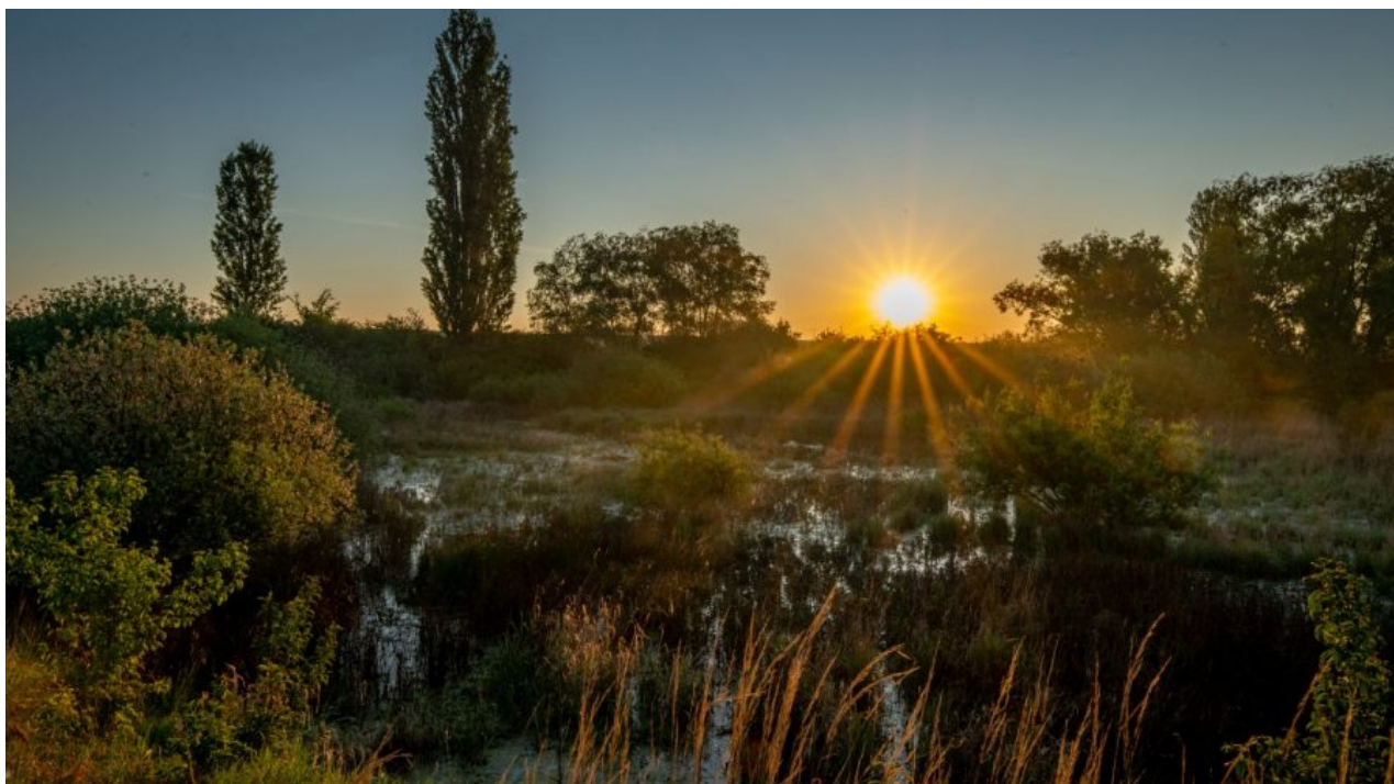
Ilustrační foto. Český mokřad Žabák – svítání.

Podle Naumannových pozorování se v posledních třech letech změnila „struktura srážek“. Dopady klimatických změn jsou zřetelně patrné i v německých lesích. Všude je patrné, že při až sedmítýdenním období bez deště a při poškození stromů před zakořeněním jsou stromy náchylnější podléhat škůdcům.