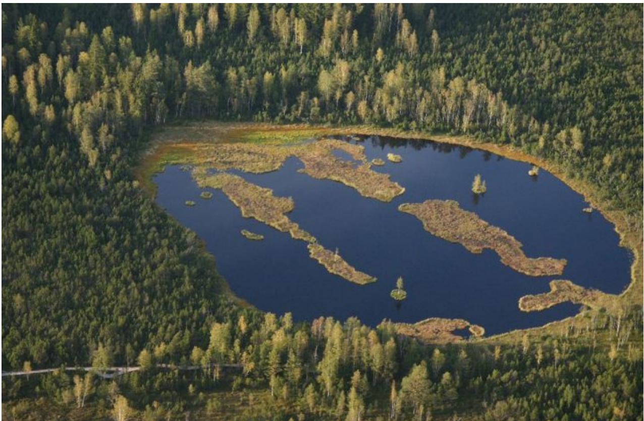
Rašeliniště Chalupářská slať. (npsumava.cz)

Pokud zůstaneme u tématu CO 2 , jsou podle Neumana mnohem důležitější rašeliniště, která ukládají velké množství CO 2 . V Německu jich však zůstala pouze dvě procenta a ani tyto již nejsou ekologicky nedotčené.