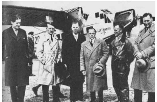
Hitler a Hanfstaengl (první zleva) vedle letadla v průběhu opakujících se předvolebních letů. Několikrát s nimi letěl i syn Winstona Churchilla.

Existuje jen jedna odpověď: všechny Hanfstaenglovy aktivity měly přesvědčit Hitlera o nezbytnosti přátelství s Anglií a Spojenými státy, a aby to mohl udělat, tlačil Hitlera k nejsilnějšímu muži na boží zelené Zemi. Skutečně, dokonce i Führerova nepřítomnost britskému lordovi nezabránila v probírání několika velmi citlivých záležitostí. S kým? S Hanfstaenglem. „Řekněte, co si váš šéf myslí o alianci mezi Francií, Anglií a vaší zemí?“, zeptal se Churchill. (Hanfstaengl: „Hitler: Ztracená léta“).