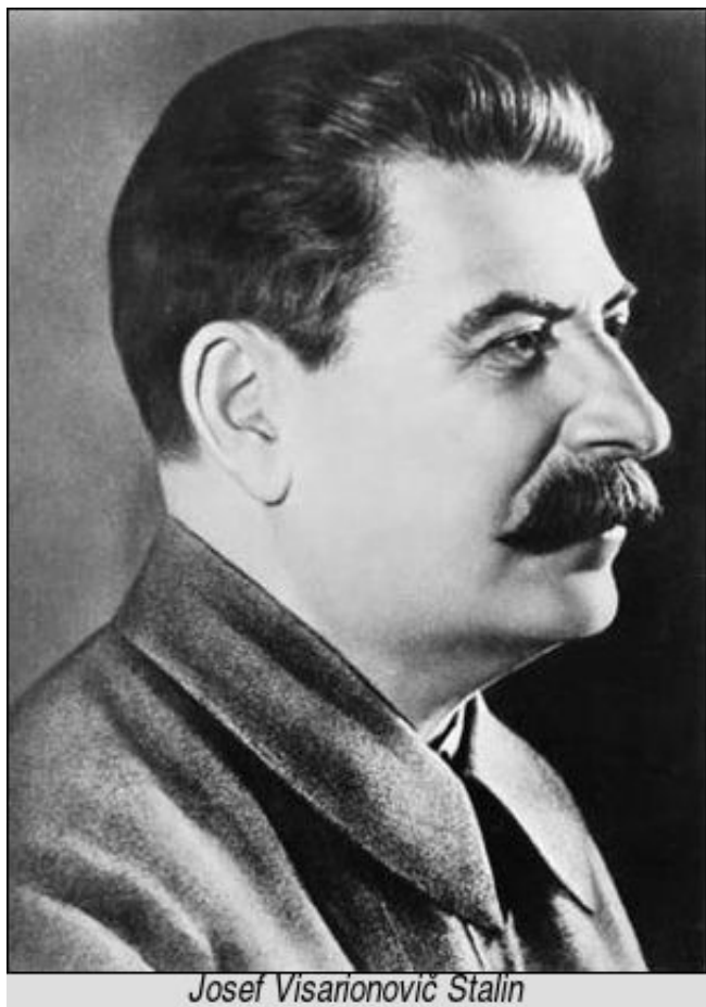
Josef Visarionovič Stalin

Rusko zpět do původního stavu. V době, kdy zakladatel sovětské vlády v r. 1924 zemřel, vše bylo stále ještě velmi křehké. Ekonomika musela být restrukturalizována a v tomto směru vypukl v SSSR boj mezi dvěma myšlenkami, dvěma jedinci, dvěma filosofiemi, o to, jak zemi rozvíjet. Když Lenin ležel ve své rakvi, pustili se do něj Josef Stalin a Lev Trocký, kteří bojovali o to, kdo získá nadvládu nad komunistickou stranou a právo řídit zemi. Není třeba uvádět podrobnosti o životopisu těchto vůdců a všech těch pletkách v sovětské politice, o této problematice existují již tisíce knih. Nás zajímá pochopení klíčových okamžiků v tomto střetu, a co to znamenalo, protože tento boj v kancelářích v Kremlu, daleko od Mnichova, sehrál velkou roli v osudu tehdy neznámého německého kaprála – Adolfa Hitlera.