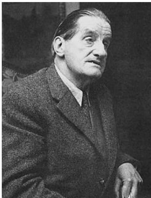
Ernst Sedgwick Hanfstaengl