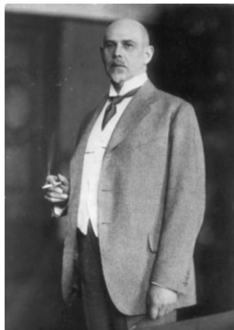
Walter Rathenau (1867-1922)

Jak v Německu rostlo vnitřní napětí, zvyšoval se souběžně s tím vnější tlak na německou vládu. Záminkou bylo zpoždění v reparačních platbách. Ještě před ne tak dávno země Entente na této frontě na Němce nespěchaly, ale náhle to bylo něco jiného. Po zavraždění Rathenau a rezignaci Wirtha přišla ještě přísnější opatření. V lednu 1923 okupovaly francouzské síly německé Porúří – jeho hlavní průmyslovou oblast – aby ovládly přepravní a těžební aktivity. Německá vláda vyzvala své občany, aby zaujali jen pasivní odpor. Ale Francouzi se chovali jako skuteční okupanti. Například stříleli kulomety do demonstrace dělníků v Essenu, kdy jich 13 zabili a přes 30 zranili. Když se na pohřbu obětí ukázalo přes