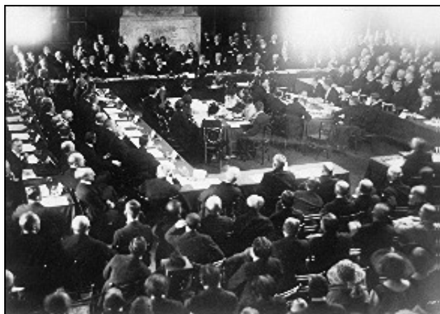
Konference v Janově

jejich podpory v r. 1921 nebyla, ani na počátku r. 1922. Historici nám neříkají o nacistickém finančním „zázraku“ během tohoto období nic.