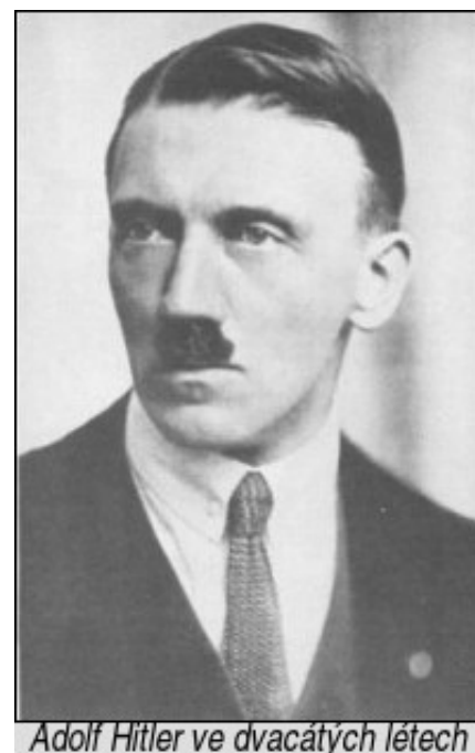
Adolf Hitler ve dvacátých letech

Jak se říká, žebráci si nemohou vybírat, a to je důvod, proč byli všichni první stoupenci Hitlera idealisté. Protože jejich vůdce nepracoval pro peníze, ale pro myšlenku, a to mu přineslo stejný respekt a obdiv, jako jeho řečnické schopnosti. Kdy se finanční situace nacistů začala zlepšovat? Když to potřebovali nejvíce. Jak můžeme vidět, žádná potřeba